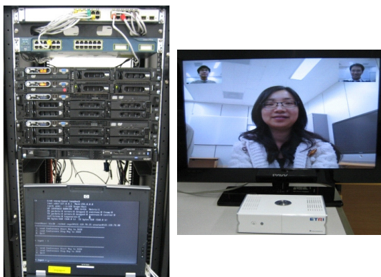
(a) IPTV 참여형방송 시스템 서버 (b) IPTV 시청자(STB)

IPTV 참여형방송 기술은 1차적으로 Leadtool software[16] 기반으로 구현하였으나[17] 그 성능을 분석한 결과 약 1.2초 정도 지연 시간이 걸렸다. 이는 실제 IPTV 참여형방송 서비스로 적용하기에는 너무 긴 시간이다. 그래서 본 고에서 소개한 시스템은 IPP[14]를 이용해서 방송자와 참여자 모듈 및 믹서서버에서 미디어를 효율적으로 처리함으로써 지연시간을 약 0.5초 내로 줄일 수 있었다. 이는 참여자들이 실시간으로 참여하는 데 지장이 없이 IPTV 참여형방송 서비스의 실현 가능성을 높였다.