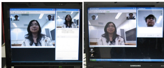
(a) 방송자 화면 (b) 참여자 화면