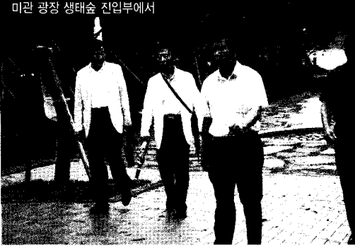
미관 광장 생태숲 진입부에서