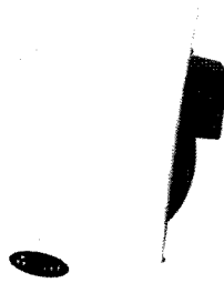
외형크기 : 300×300mm