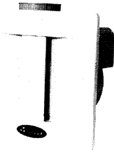
외형크기 : 280×280mm

인하전기는 전동기, 발전기, AC모터, 욕실용환풍기, 환풍기, DC모터 등을 전문적으로 생산, 판매, 유통하고 있는 회사로써 오랜 노하우와 끊임없는 기술연구, 개발을 통해 고객들에게 끊임없는 사랑과 지지를 받아왔다. 또한 고객을 가장 소중히 생각하며 신용을 최우선으로 고객의 요구에 적합한 제품과 서비스를 제공하기 위해 최선을 다하고 있다.