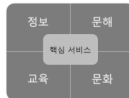
<그림 1> 공공도서관 선언이 제언하는 도서관 핵심서비스

이러한 시대의 변화를 반영하여 국제도서관연맹과 유네스코는 공공도서관 선언(IFLA/UNESCO 1994, 2004), 공공도서관서비스 가이드라인(IFLA 2001), 다문화도서관 선언(IFLA 2006), 다문화도서관서비스 가이드라인(IFLA/UNESCO 1998), 다문화도서관서비스 전략계획(IFLA 2004, 2006, 2009)을 발표하였다. 1994년에 발표하고 현재 국제도서관연맹 홈페이지에서 영어, 중국어, 일본어를 비롯한 29개 언어로 제공하고 있는 공공도서관 선언에서는 지식의 관문으로서의 공공도서관은 정보, 문자해독, 교육, 문화와 관련된 도서관 핵심서비스에 지역사회 구성원 모두가 접근할 수 있어야 하고 네트워크로 연계되며 아웃리치와 이용교육 프로그램도 제공해야 함을 선언하고 있다.