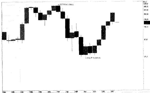
그림3. 건설업체 A 주가의 연단위 변화 추이

이러한 과정을 거쳐 최종적으로 산정된 static NPV는 수주금액의 약 2%에 해당하는 1358.4 - (1258.5 + 0.9 + 62.9) = 36.0 백만 불로서 대기업 입장에서, 그리고 한정적인 자원을 운용해야 하는 포트폴리오 측면에서 크게 매력적인 투자치는 아니라는 결론을 내릴 수 있다.