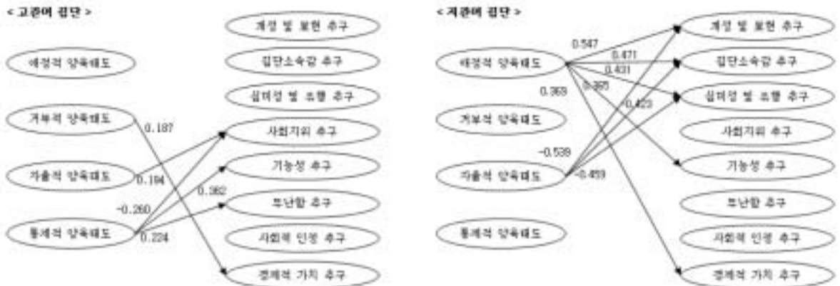
〈그림 2〉 어머니 의복관여 집단에 따른 양육태도-자녀의복 추구혜택 경로 비교

가장 많은 의복 혜택에 영향을 미치는 양육태도 역시 어머니의 의복 관여도에 따라 차이가 있었다. 고관여 집단에서는 통제적 양육태도가 가장 다양한 의복 추구혜택과 유의한 관계가 있었으며, 저관여 집단에서는 애정적 양육태도와 자