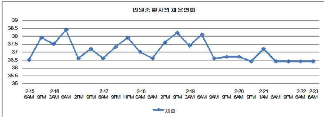
Fig 2. Change of body temperature in case 2

5) 08.3.19~09.8.7 (외래통원치료 63회) 환자 이후 발열 기침 가래 콧물 등 증상호소 없이 중풍후유증 관련 외래 통원치료 중임. (Table 3)(Fig 2)