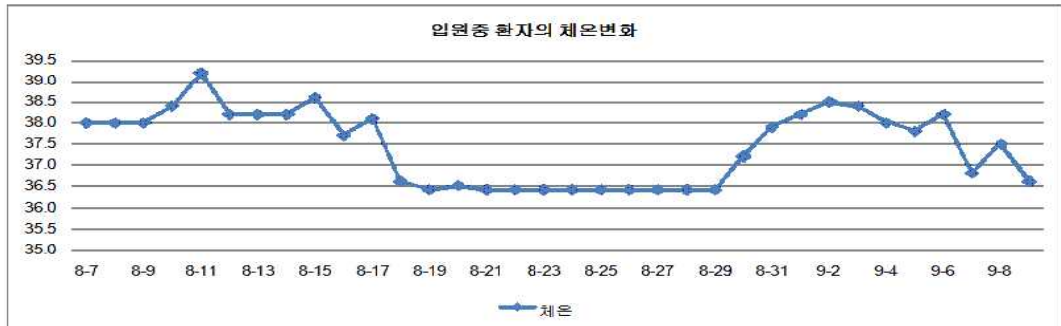
Fig 3. Change of body temperature in case 3

일 US Guided Aspiration으로 염증과 농 확인되어 수술과 6주간 항생제 필요하다 진단 받음.