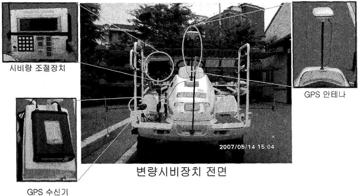
Fig. 1. Variable Rate Applicator.

시험전·후 토양의 화학적 특성 평균치를 나타낸 것은 표 1과 같다. 시험전 토양은 유기물, 인산, 양이온 및 질소시비 검정량 등 각각의 함량 평균치가 처리간에 큰 차이 없이 균일한 분포를 나타내었으나, 변량시비를 위해 10a당 질소시