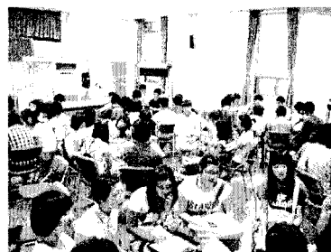
<그림 3> 오프라인 캠프 활동

오프라인 캠프 활동은 다양한 탐구 활동을 통한 학생들의 학습 참여 및 학생들과 멘토들 사이의 인간적인 유대감을 강화시키고자 하는 목적으로 시행되었다. <그림 3>은 실제로 이루어진 오프라인 캠프 활동을 보여준다. 지역 기관의 협조를 얻어 총 9개 중학교 70여명의 학생을 대상으로 2박 3일의 일정으로 실시되었다. 실제로 이러한 활동의 전후를 비교해보면 학생들의 사이버 멘토링 참여율이 많이 달라진 것을 알 수 있었다.