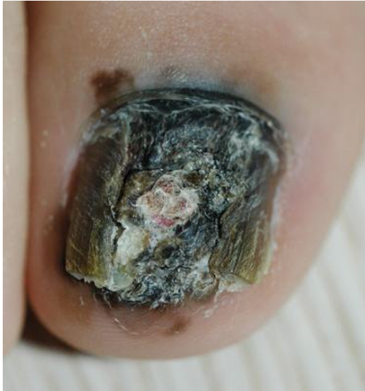
Figure 1. Right big toe of patient shows melanochia with pigmentation on nail fold and subungual area. Onycholysis combined.

Jung Yeob Sung. A Case of Malignant Melanoma During Hormone Therapy. Korean J Reprod Med 2009.