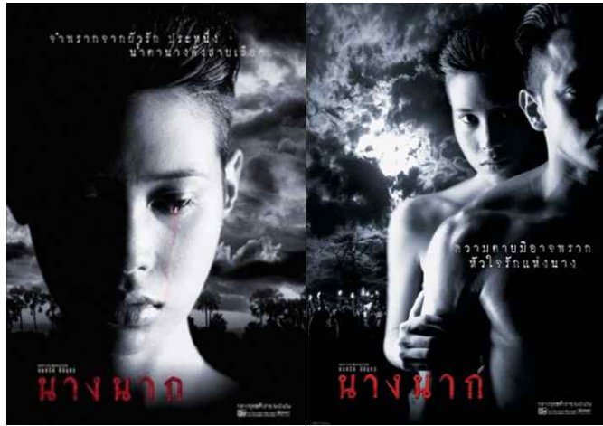
<그림 1> 영화 <낭낙>의 포스트

들에서 볼 수 없는 여성상을 보임으로써 태국에서 블록버스터였던 <타 이타닉>의 흥행기록마저도 뛰어 넘는 450만 달러라는 흥행수입을 올리며 대성공을 거두었다. 영화 <낭낙>이 발표된 1999년 9월은 태국의 경제적 위기가 가중된 시기였는데 이 영화는 태국인으로 하여금 물질적인 집착과 서구화된 사회에 관한 대중적인 관심을 끌어들이게 만든 영화이기도 했다(배수경 2007: 192).