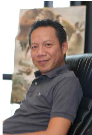
<그림 2> 영화 <낭낙>의 감독 논씨 니미붓 (Nonzee Nimibutr)

다. 주연 배우는 극중 ‘낙’역을 맡았던 인티라 짜른뿌라(Intira Jaroenpura)와 ‘막’역의 위나이 크라이붓(Winai Kraibutr)이었다.