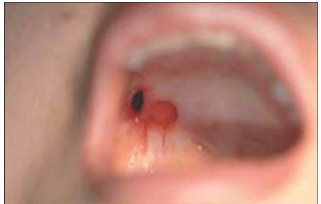
Fig. 7. Post-operative photograph after about 4 years. The defect was smaller, but remained.