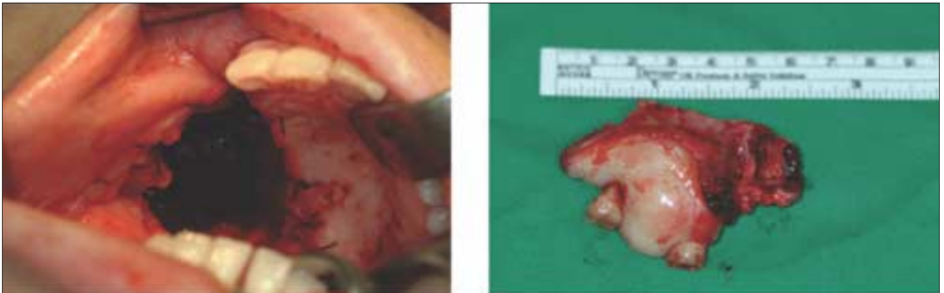
Fig. 5. Tumor mass is removed by partial maxillectomy.