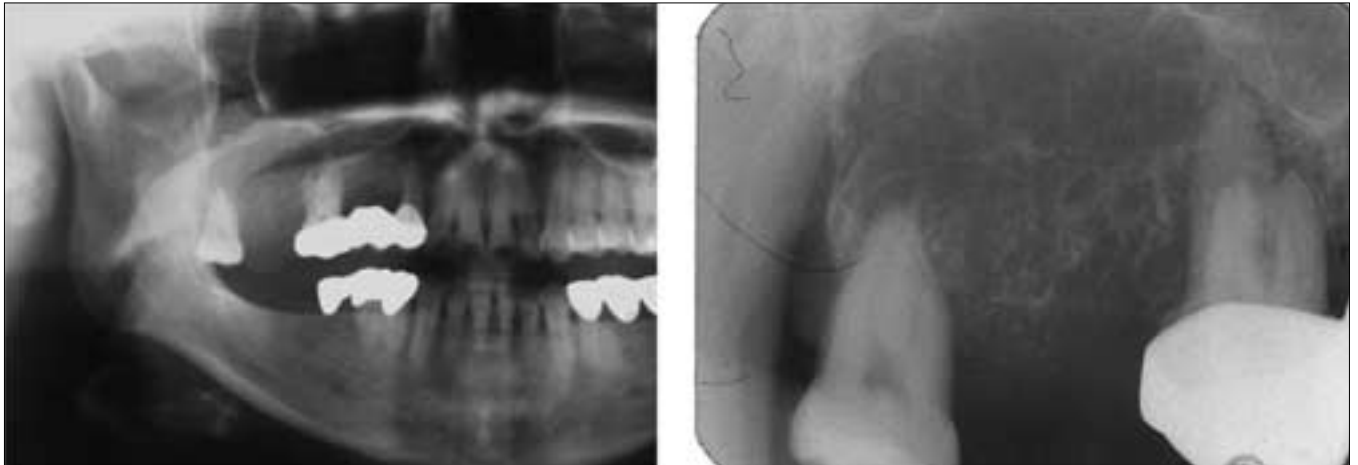
Fig. 2. Panoramic & Periapical radiograph showing elevated soft tissue and central radiolucency with wispy & straight septa. The lamina dura of #16 & #18 was lost.