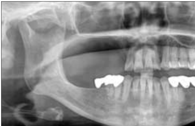
Fig. 6. Post-operative panoramic radiograph after about 2 years. No recurrence was developed. A large defect on the operation site.