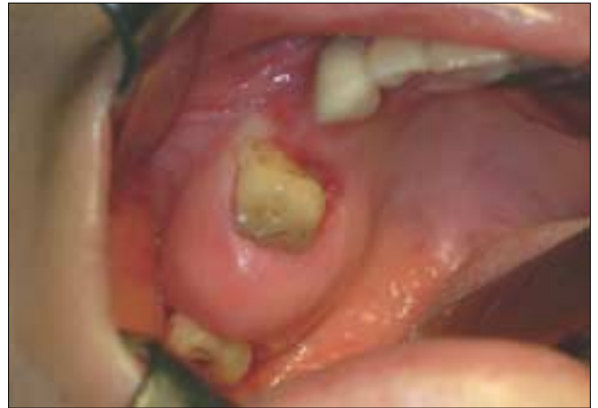
Fig. 1. Clinical photograph on first visit showing bony expansion on #17 area. Mucosa over the lesion was showing normal color.

술 후 4년 6개월 동안 정기적인 임상적 및 방사선학적 추적조사를 시행하였으며, 현재까지 재발 소견없이 양호한 예후를 보여주고 있다(Fig. 6, 7).