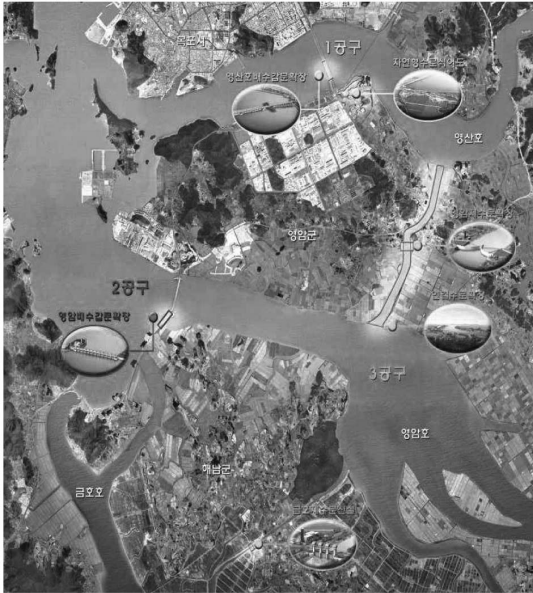
그림 3-1 영산강하구둑 구조개선 사업도

영산강 하구둑 구조개선은 관련 시설물을 대상으로 그동안의 여건변화를 반영하여 재해대비 능력강화, 수질개선, 생태환경조성 등이 연계된 종합적인 구조개선을 추진하는 사업으로 주요 사업내용은 <표 3-1> 및 <그림 3-1>과 같다.