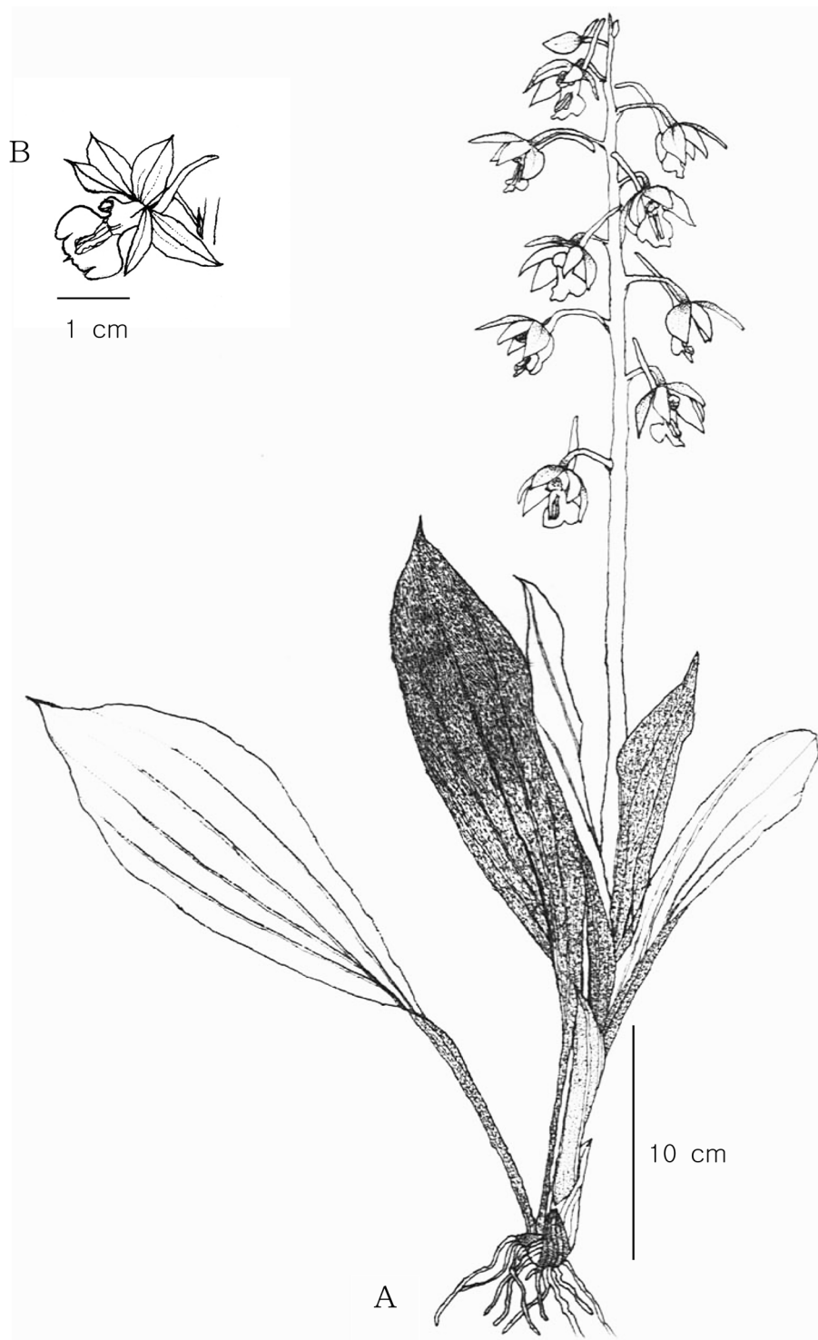
Fig. 1. Calanthe aristulifera Rchb. f., A: Habit; B: Flower.

피편은 외화피편과 길이는 같지만 폭이 더 좁다. 순편은 부채모양으로 붉은색을 띠는 3줄의 돌기가 있고 3개의 열편으로 갈라지며 가운데 열편은 끝이 뾰족하게 돌출되어 있다. 자방에 털이 있고, 거는 14-18 mm로 내화피편보다 길며 자