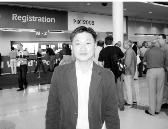
▲ 학회등록 창구 앞에서