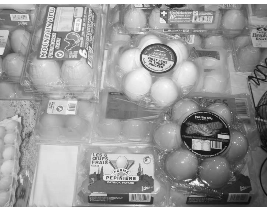
▲ 세계가금박람회장에 전시된 포장란

요구되는 기기 개발의 목적과 개선점에 대해서도 심도 있는 토의가 있었다.