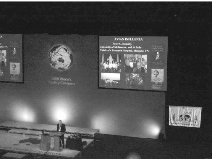
▲ 세계가금학회 본 회의장