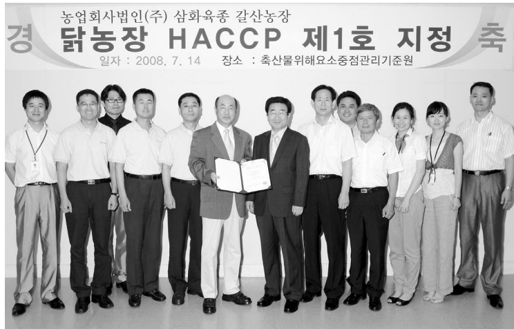
▲ 지난 7월 삼화육종 GPS 갈산농장이 국내 양계장로서는 처음으로 축산물위해요소중점관리기준원으로부터 HACCP인증을 받았다.

지난 2004년 정부의 적극적인 개입 하에 육용원종계 쿼터제가 본격 시행되면서 긍정적인 평가를 받은 바 있다. 하지만 시장경제 논리가 지배적으로 작용하다보니 쿼터제는 무용지물로 전락하였고, 2006년 14만수, 2007년 16만수에 해당하는 GP가 들어오면서 적정수수인 12만수를 넘겨 육계산업 자체를 과잉으로 몰고 가는