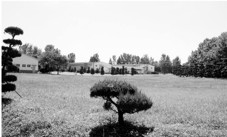
▲ 농장로서는 최초로 HACCP 인증을 받은 갈산농장 전경