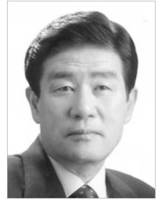
▲ 김광원 회장

신임 김광원 회장은 40년생 경북 울진 출신으로 서울대를 나와 포항시 시장과 경북도 부지사를 거쳐 제15대, 16대, 제17대 국회의원을 지낸 3선의원으로 국회 농림해양수산위원회 위원장을 역임했다.