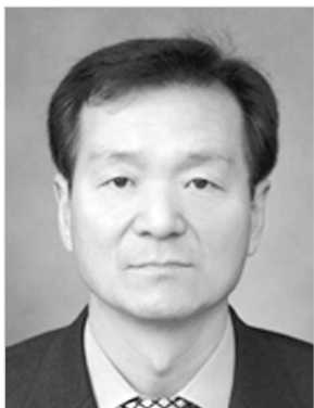
김 광 겹

따라서 본고에서는 앞으로의 농가 방역대책에 참고가 될까 해서 우리 시에서 추진했던 사례를 간략히 소개하고자 한다.