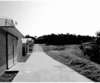
계사와 계사간 통로는 모두 콘크리트로 되어 있어 차단방역에 용이하다.