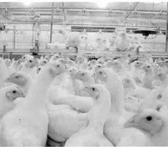
갈산농장 내부-18주령된 GPS