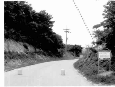
농장진입로도 깨끗하게 포장되어 있으며, HACCP 농장임을 알리는 방역판이 설치되어 있다.