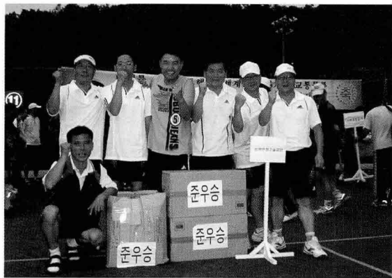
▲ 국토해양부장관배 테니스대회 준우승, 테니스 동호회 (7월 12일, 과천 정부종합청사 테니스코트)