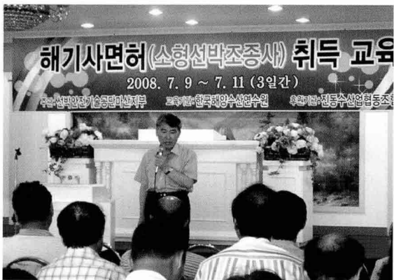
▲ 해기사면허 취득교육, 마산지부 (7월 9~11일, 마산시 진동수협)