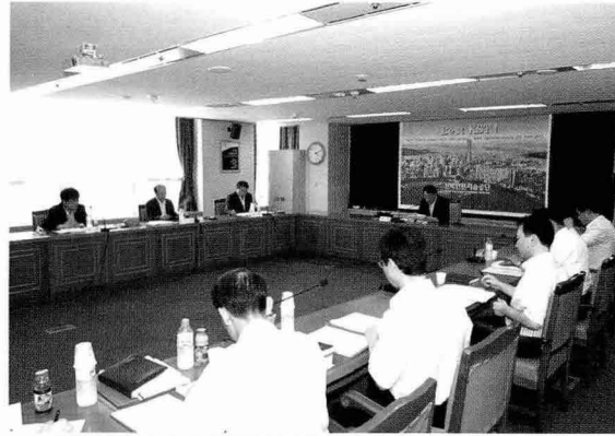
▲ 2008년도 제 10차 이사회 개최 (6월 18일, 본부 12층 대회의실)