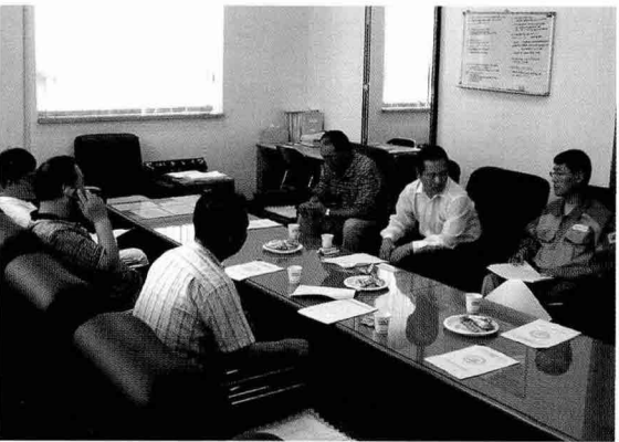
▲ 조선사업자(강선)와 간담회 개최 (7월 23일, 목포지부 회의실)