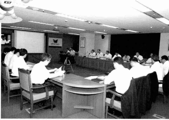
▲ 7월 경영전략포럼 개최 (7월 7일, 본부 12층 대회의실)