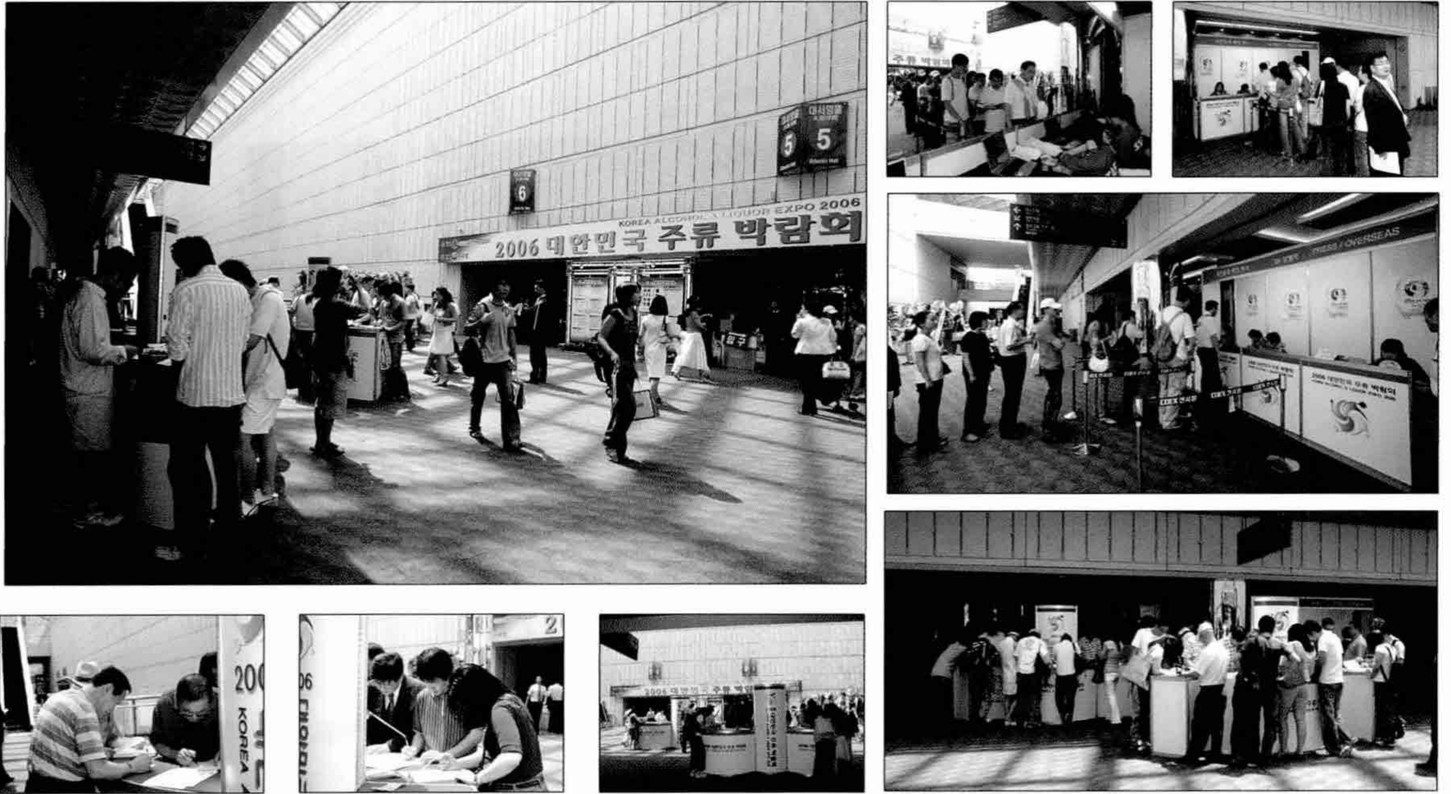
2006년 대한민국 주류박람회 관람객 등록현장