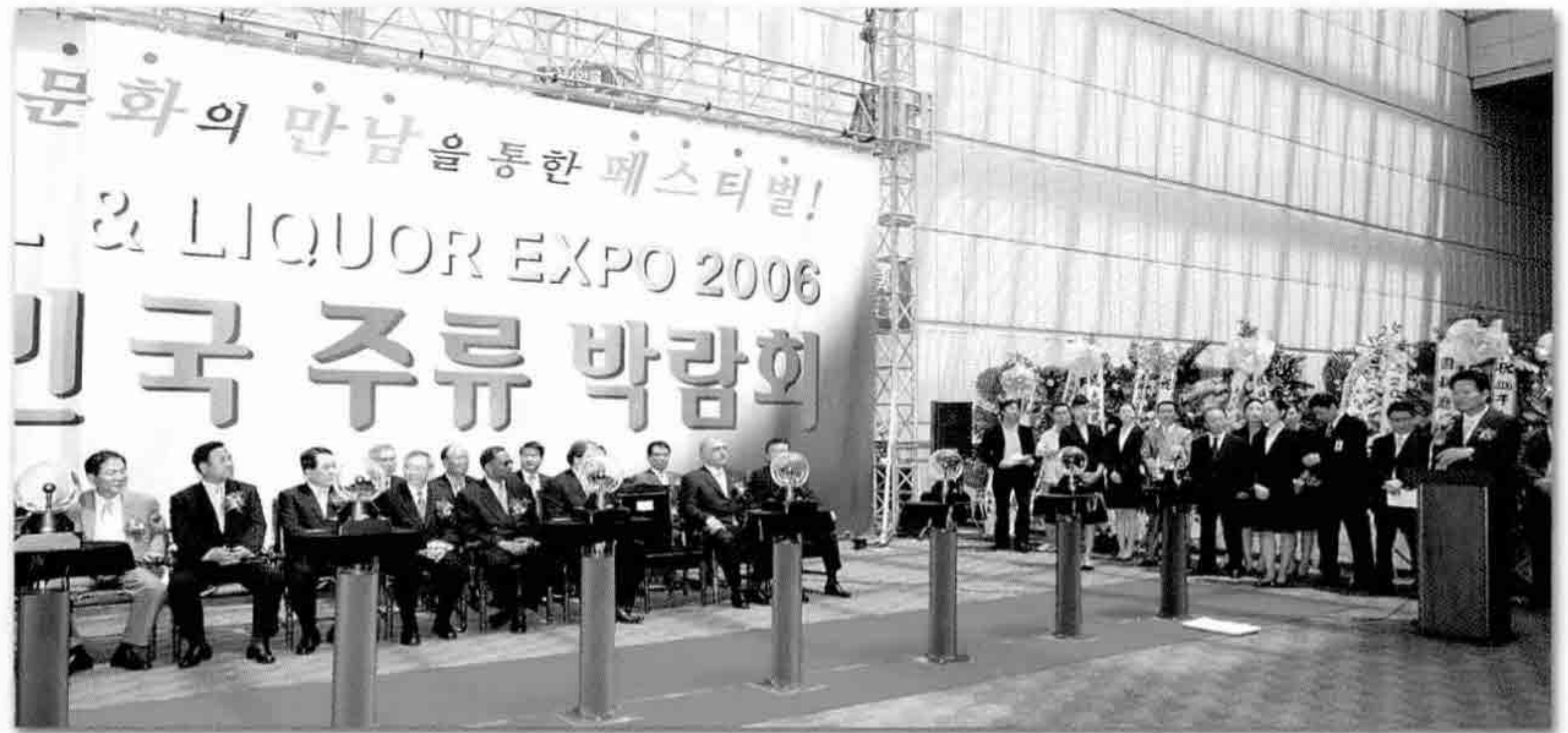
2006년 대한민국 주류박람회 개막식 장면