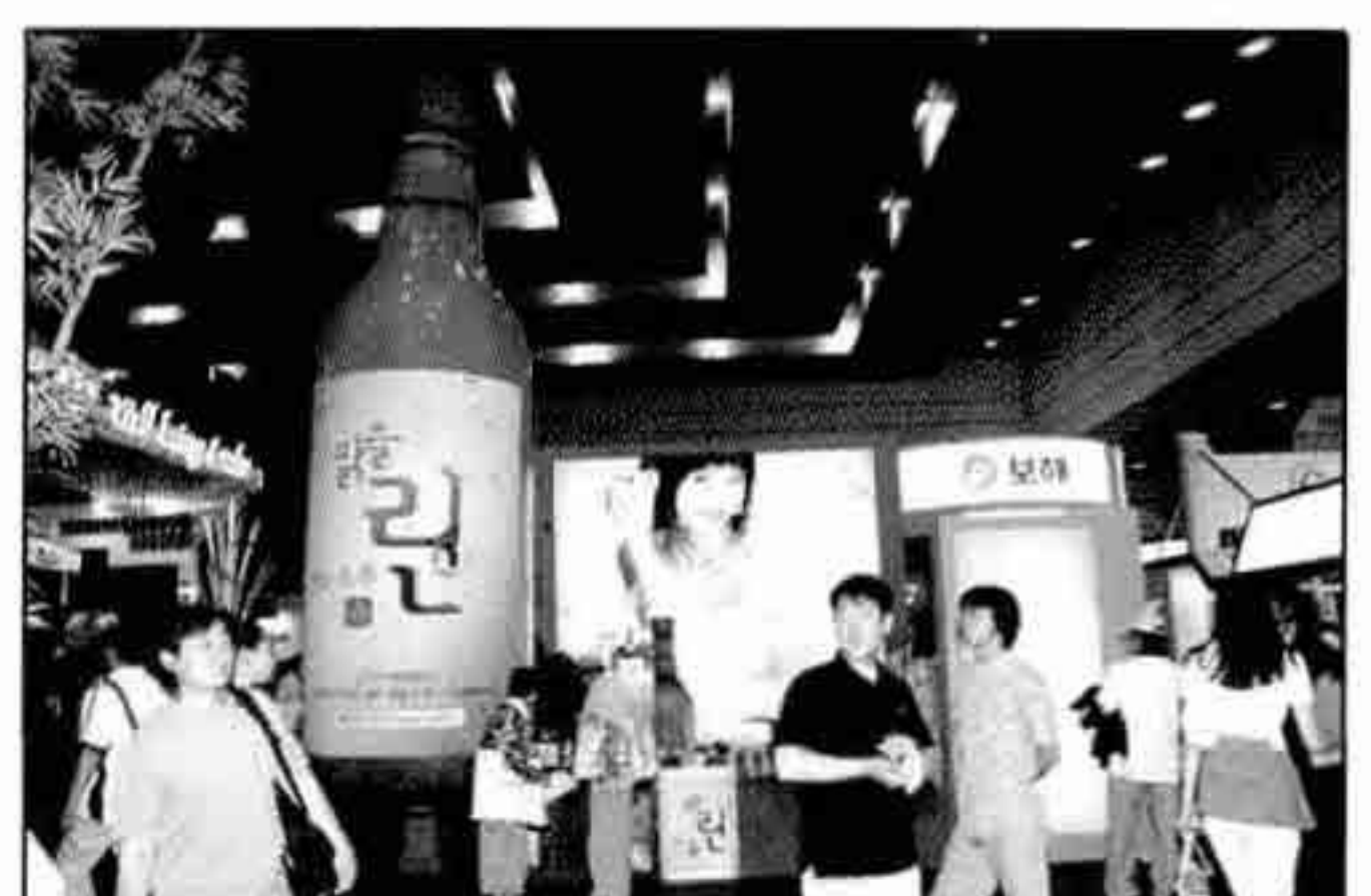
2006년 대한민국 주류박람회 전시 부스