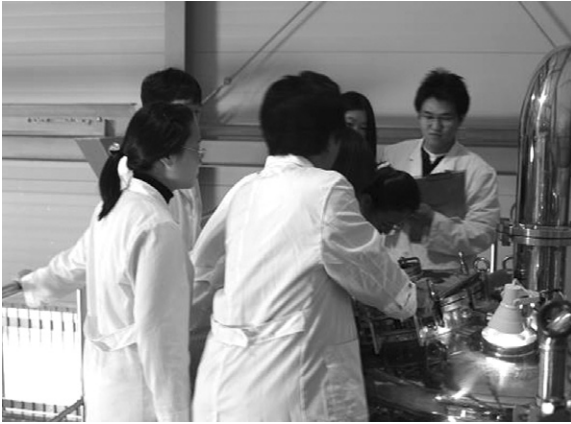
표 5. 연간 수익