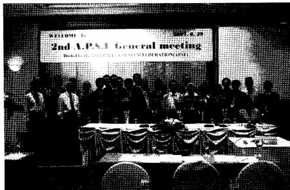
제 2회 APSF 정기총회