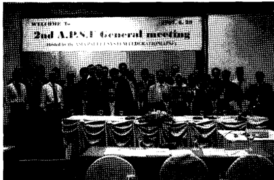
제 3회 APSF 정기총회