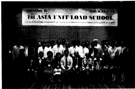
제 1회 아시아 유닛로드스쿨