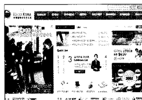
WATER KOREA 홈페이지 www.wakoex.co.kr

※ 담당 : 물산업육성팀 고희찬 대리 (직통전화 : 02-3156-7741)