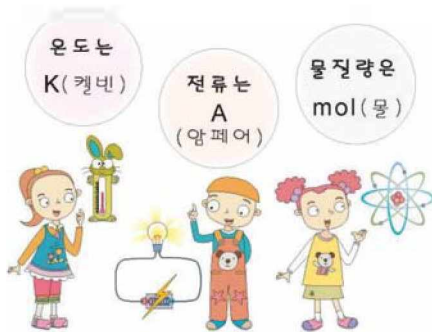
〈표〉 SI 기본단위