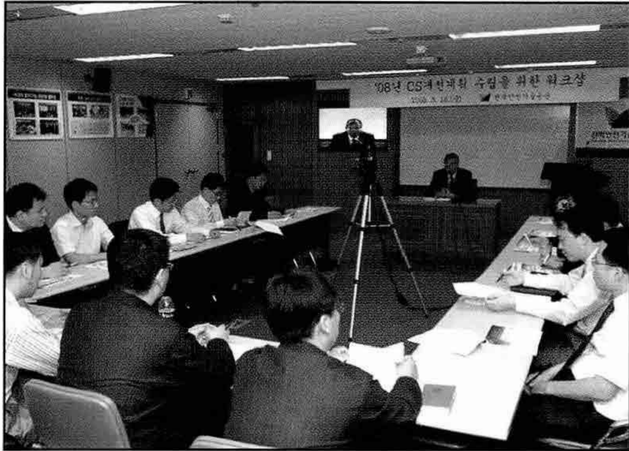
▲ 고객만족향상을 위한 워크숍 개최

고객지원팀은 지난 5월 16일 본부 대회의실에서 팀·지부별 고객관계관리담당자(CRO)를 대상으로 워크숍을 개최하였다.