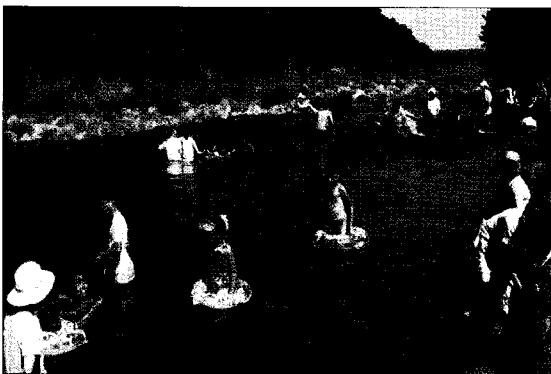
〈그림 3〉 강정천 유원지

수면위로 더 반짝이는 은어가 뛰어오르면 내 눈 한가득 별을 머금곤 했다. 은어는 낚시로 낚아야 제 맛이다. 미끼도 달지 않고 물결 따라 낚는 것이다. 하지만 어린 나이에겐 고난이도의 기술이었다. 우리는 주로 낚시 바늘에 밥알 하나를 끼워서 모앵이(송사리) 낚시를 자주 했다. 조그만 대나무로 낚싯대를 만들어서 하기도 하고, 그냥 맨손으로 줄낚시를 하기도 했다. 물이 워낙 맑아 밥알 주위로 모여드는 모앵이를 보면서 낚는 맛은 보통 저수지나 바다에서 낚는 것과는 전혀 다른 색다른 재미였던 것으로 기억한다.