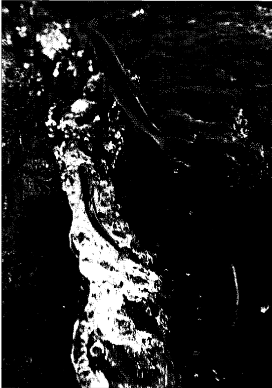
〈그림 2〉 강정천 은어 - 21일 제주도 서귀포시 강정천 하류에서 바다에서 지란 은어들이 힘차게 뛰어 오르며 하천을 거슬러 올라가고 있다. 오는 30일부터 다음달 2일까지 강정천올림은어축제 가 열린다.

르는 하천이 있다는 사실을 아시는 분들은 거의 없다. 위에서 언급했던 바와 같이 상류부로는 숨골로 하천수가 스며들어 하천수가 흐르지 않지만 하천중간에 지하수가 용천하여 하천으로 유입되면서 항상 물이 흐르는 하천이 된 것이다. 이런 하천 중에 강정천이 있으며 강정천에는 식수용 댐이 있고 그 하류에는 특히 은어가 많다. 뜨거운 태양 아래 반짝이는