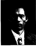
글 | 박창복 전 한국화재보험협회 중앙지부장