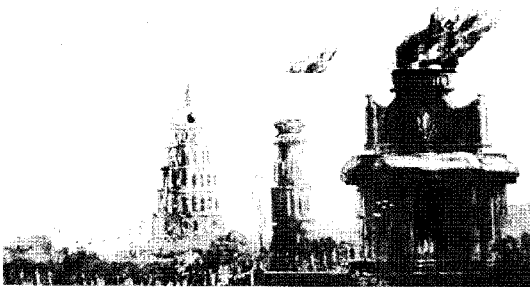
[그림2] 불의 신 아그니를 모시는 마가다국의 우루빌바 카사파(Uruvilva kasyapa) 사원

아그니 신은 세상을 밝게 빛나는 힘을 가졌고, 모든 존재 속에 숨어 있기에 모든 사물을 안다고 한다. 또한 그 불이 하늘로 솟구쳐 올라 이내 연기로 화하여 하늘 높이 허공 속으로 사라지기 때문에 그것은 지상의 소망을 하늘의 신에게 전달하는 중요한 중개자로서의 역할을 한다. 더구나 신에게 올리는 제사가 중요시되었던 고대 인도인들에게 아그니 신은 지상의 인간과 천상의 신과 조상을 연결하는 중요한 역할을 했던 것이다. 그가 인간이 바친 공양물을 천상에 전달하면 신들은 그것에 의하여 힘을 얻어 악마의 무리를 쳐부술 뿐 아니라 인간에게 복을 부여한다.