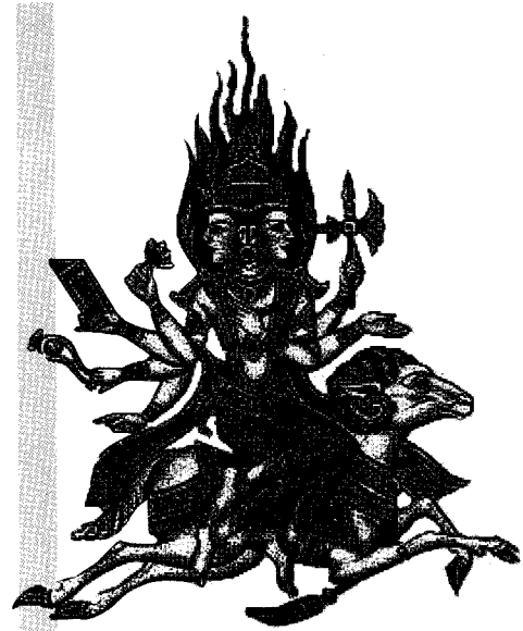
[그림3] 불의 신, 아그니 세밀화

불의 신 아그니에게는 세 명의 형들이 있었다. 그들은 희생제의에서 인간들이 바친 공물을 신들에게 운반하는 도중에 모두 죽었다. 이를 본 아그니는 자신도 죽게 될 것을 두려워하여 스스로 모습을 감추어 버렸다. 그는 우선 불속으로 들어갔다. 그가 사라지자 악마들이 나타나 세상을 혼란스럽게 만들었다. 신들은 악마들과 전쟁을 일으켜 그들을 모두 처치하고 난 다음 아그니를 찾아 사방으로 돌아다녔다. 왜냐하면 신들은 그가 없어지면서 공양을 받을 수 없는 처지에 놓이게 되었기 때문이다. 신들과 아그니 사이에 쫓고 쫓기는 줄다리기 끝에 마침내 신들은 아그니가 사미(Sami, 서로 비벼서 불을 일으키는 나무 막대기의 원료) 나무속에서 잠을 자고 있는 모습을 발견했다. 신들은 그 나무를 모든 제사에 쓰이는 신성한 불이 거주하는 장소로 만들었다. 그때부터 아그니는 사미 나무속에 머물게 되었고, 사람들은 그 나무를 불을 피우는 도구로 사용하게 되었다. 신들은 아그니에게 찾아내어 그에게 신들의 공물을 운반해 줄 것을 부탁했다. 아그니는 자신의 생명을 늘여 줄 것, 신들처럼 공양물을 들 수 있을 것, 자신의 희생제를 올려 줄 것 등을 신들에게 부탁했다. 신들은 아그니의 요청을 기꺼이 들어주었다. “아그니여, 앞으로 소마 희생제는 전적으로 너를 위해 실행하게 될 것이다.” 신들은 음식을 차려 아그니를 초청하고, 야마에게는 왕권을 주었다. 이리하여 아그니는 신들의 음식을 먹는 자가 되었고, 야마는 죽은 조상들의 왕이 되었다. 아그니는 형제들과 함께 돌아와서 다시 신들을 위해 공물을 운반하게 되었다. 제사의식은 다시 거행되었으며 모든 인간들과 신들은 크게 기뻐했다.