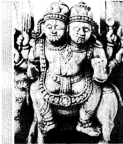
[그림1] 불의 신, 아그니 조각

화천 아그니는 지계(地界)에서 첫째가는 위치에 자리 잡고 있으며, 천계(天界)에서는 태양이 되고 공계(空界)에서는 번개 불로 되는 우주의 위대한 힘 가운데 하나이다. 그는 밝게 비추는 모든 사물들의 주인으로 불릴 정도로 막강한 위력을 발휘한다. 그래서 고대 인도에서는 이 신의 역할이 너무나 지대하여 바람의 신 바유(Vayu)와 술의 신 소마(Soma)와 더불어 삼신(三神)으로 거론되기도 했다. 불은 바람을 동반하면 더욱 거세게 타오르기 때문에 바람의 신 바유는 그의 절친한 친구이기도 하다. 아그니의 턱과 이는 황금으로 되어 있고 머리카락은 불꽃 형상을 하고 있으며, 3개 또는 7개의 혀를 가지고 있다.