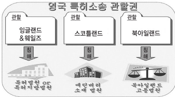
(그림 3-1) 영국 특허소송 관할권

특허소송과 관련하여 영국은 세 개의 관할권, 즉 잉글랜드 및 웨일즈, 스코틀랜드 및 북아일랜드로 나누어져 있다. 잉글랜드 및 웨일즈에서의 특허소송은 런던에 소재한 특허법원(Patents Court) 또는 특허지방법원(Patents County Court)에 제기되며, 스코틀랜드에서의 특허소송은 에딘버러(Edinburgh) 소재 법원에 제기되며, 북아일랜드에서의 특허소송은 벨페스트(Belfast)에 소재한 북아일랜드 고등법원(High Court)에 제기될 수 있다.