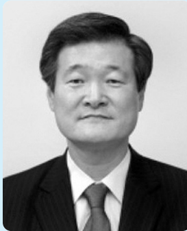
고정식 특허청장 (프로필)