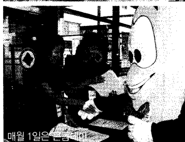
매월 1일은 콘돔데이