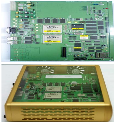
(그림 1) 검증용 단말 하드웨어