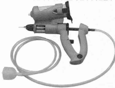
소비자가격 : 주사기 9만원, 페인트 2만원