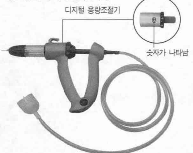
소비자가격 : 주사기 10만원(병연결 호스 포함)