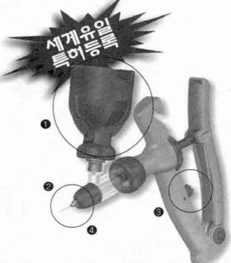
소비자가격 : 주사기 7만원, 앞부분 3만5천원, 컵(F) 2만원