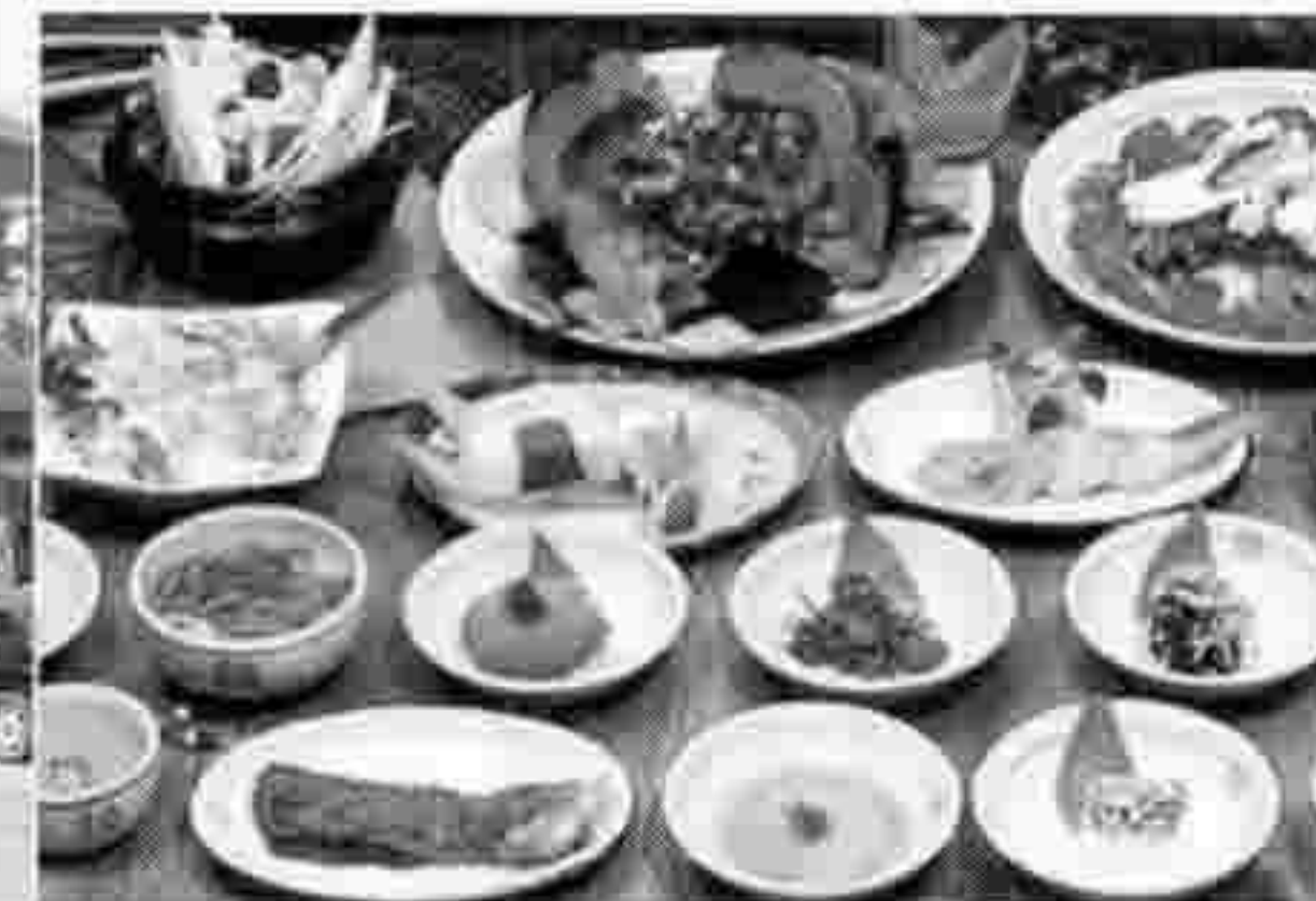
▶ 들마루 코스요리