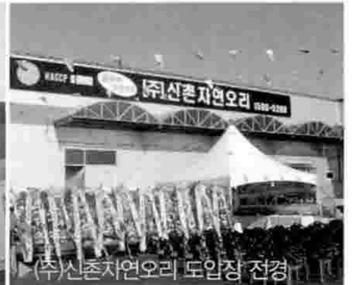
▶ (주)신촌자연오리 도매장 전경