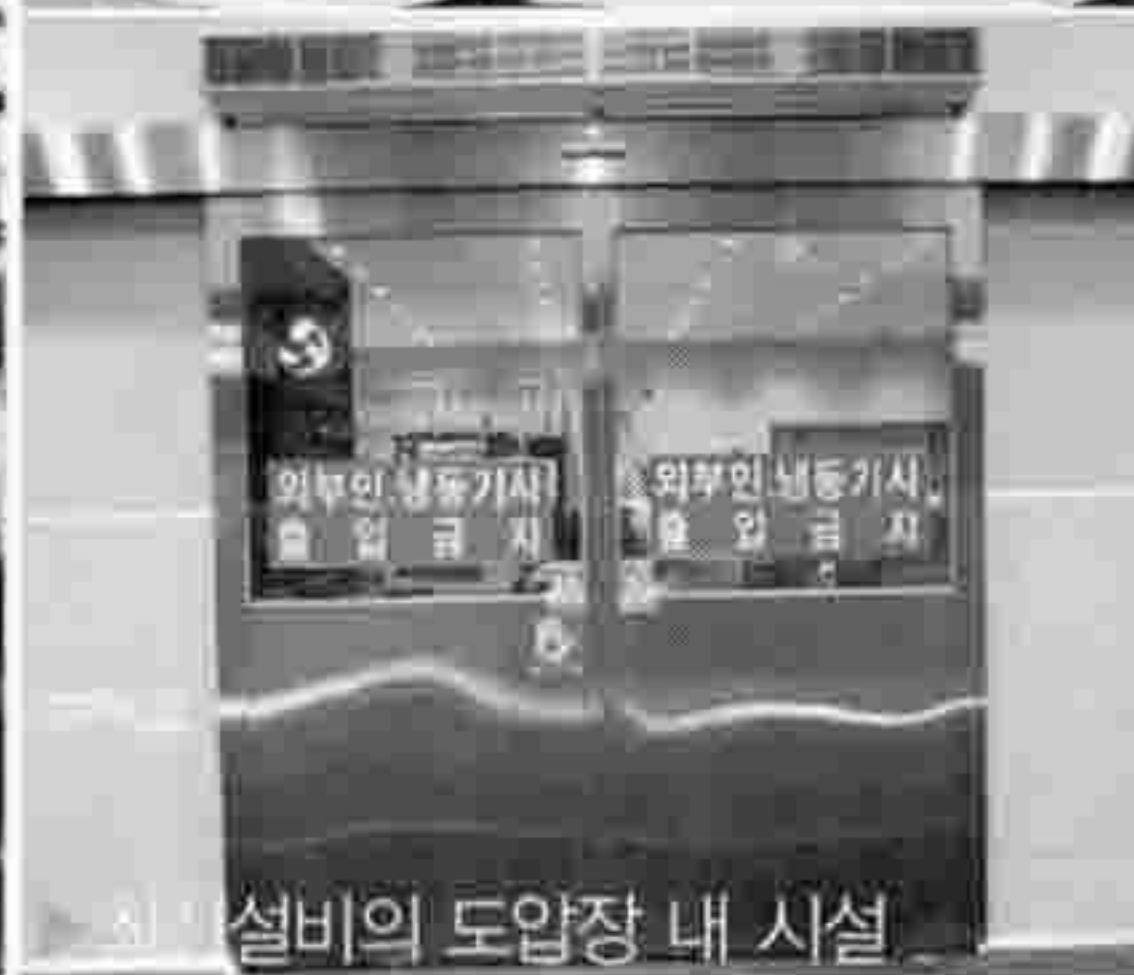
▶ 최신설비의 도매장 내 시설