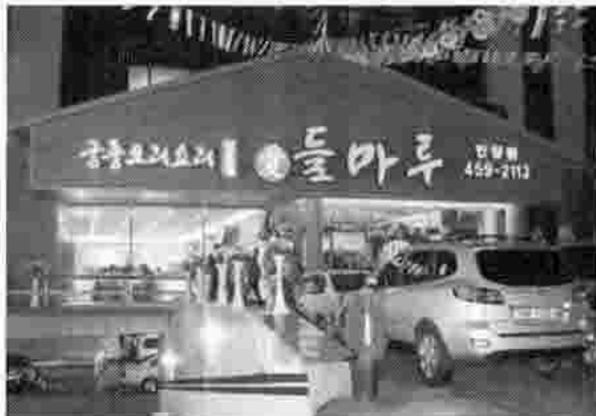
▶ 들마루 안양점 전경