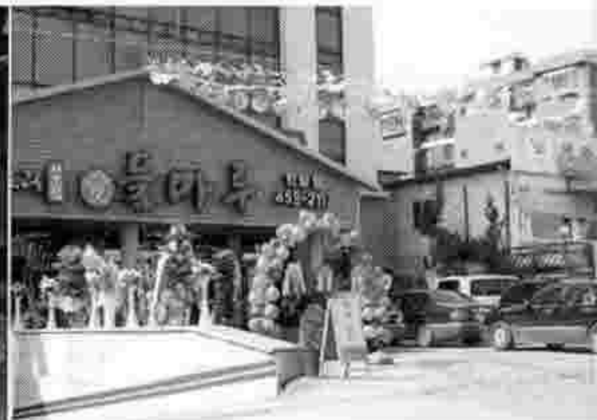
▶ 들마루 안양점 오픈