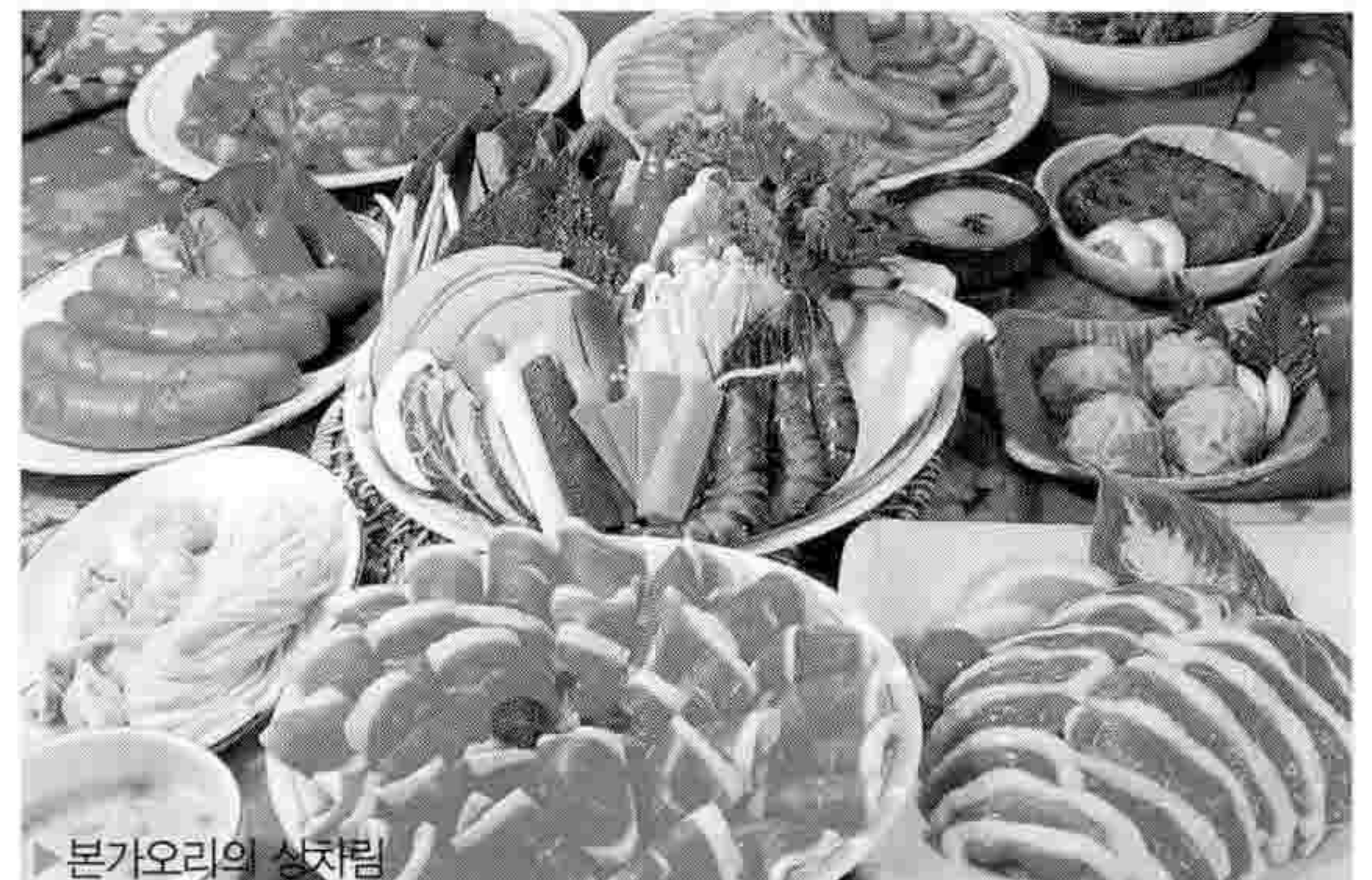
▶ 본가오리의 상차림

본가오리의 오리고기 맛을 본 축산과학원 임직원들은 오리요리가 이렇게 다양하고 맛있는 줄 몰랐다면 입을 모았다. 또한, AI 감염축들은 즉시 살처분되기 때문에 유통될 일이 없고, 걱정된다 하더라도 AI 바이러스는 먹어서는 전염되지 않는 점을 강조하며 앞으로 오리소비 홍보에 앞장서 힘을 쏟기로 다짐하였다.