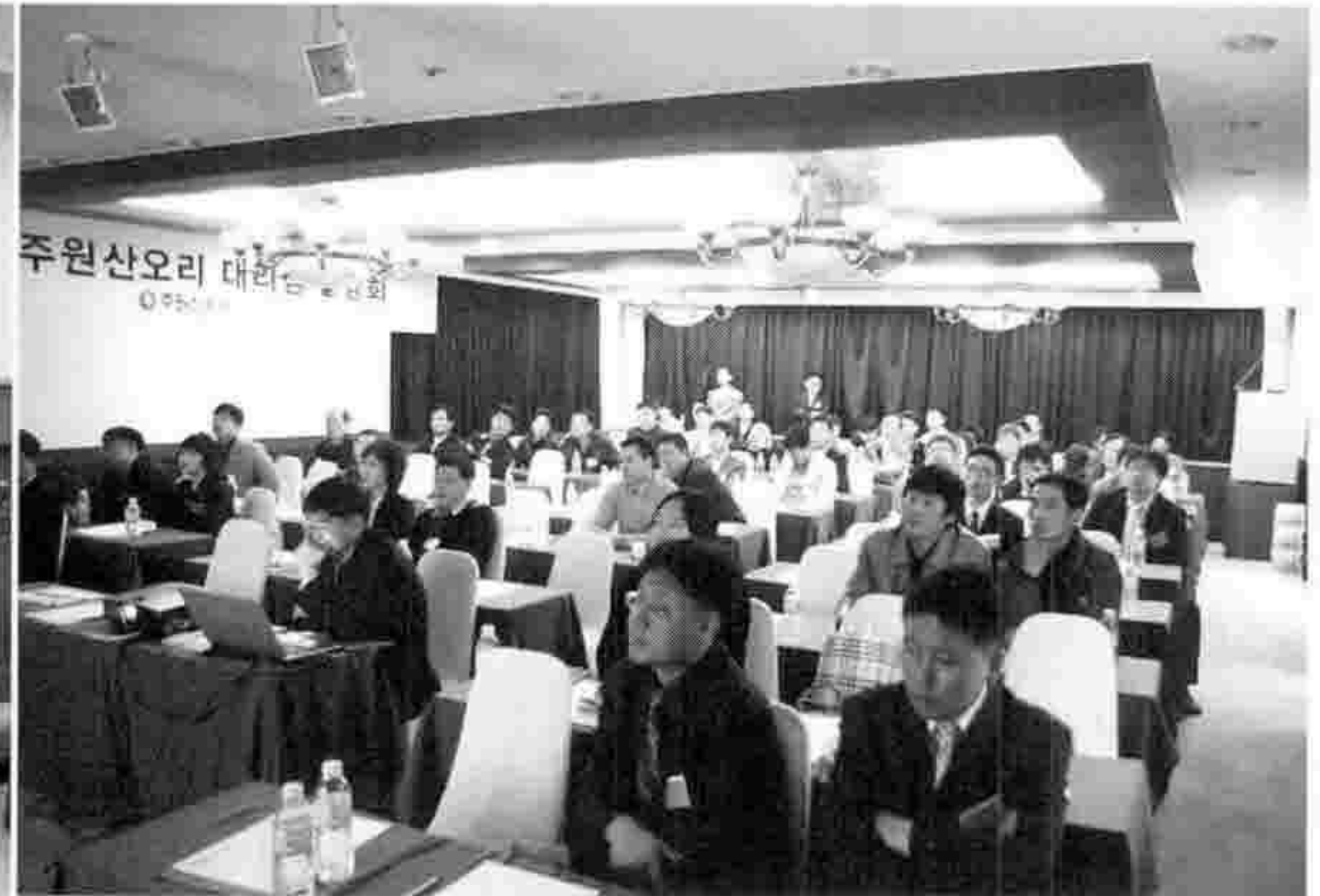
▶ 간담회에 모인 대리점 대표들