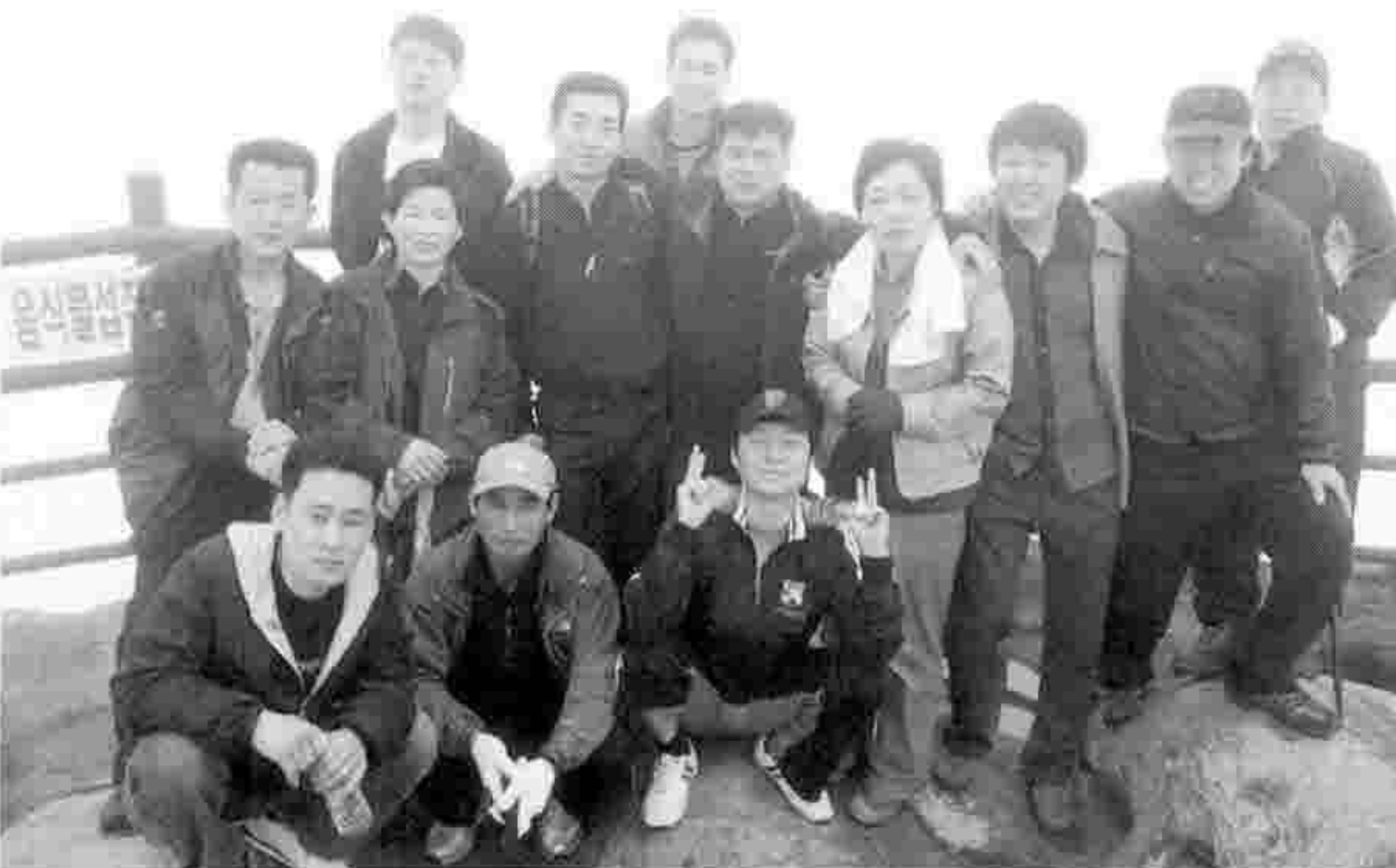
▶ 2008년 목표달성을 위한 속리산 등반 결의대회

2008년 주원산오리 대리점 간담회가 지난 3월 29일 ~30일까지 1박 2일간 속리산 레이크힐스 호텔에서 대리점 사장님을 모시고 임직원이 참가한 가운데 개최되었다.