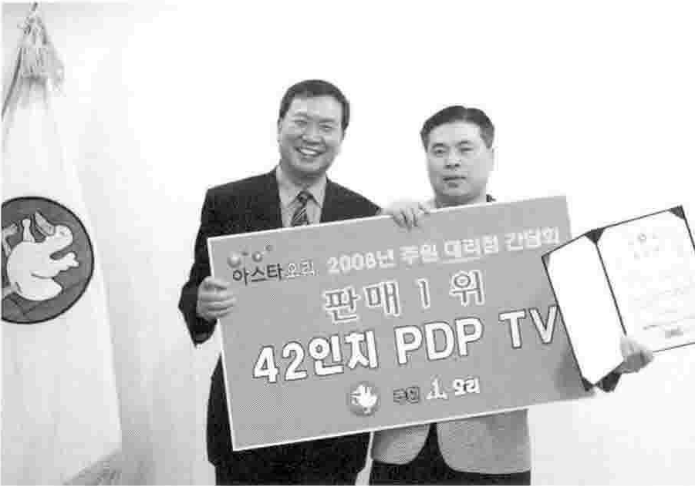
▶ 우수 대리점 표창과 감사패 전달