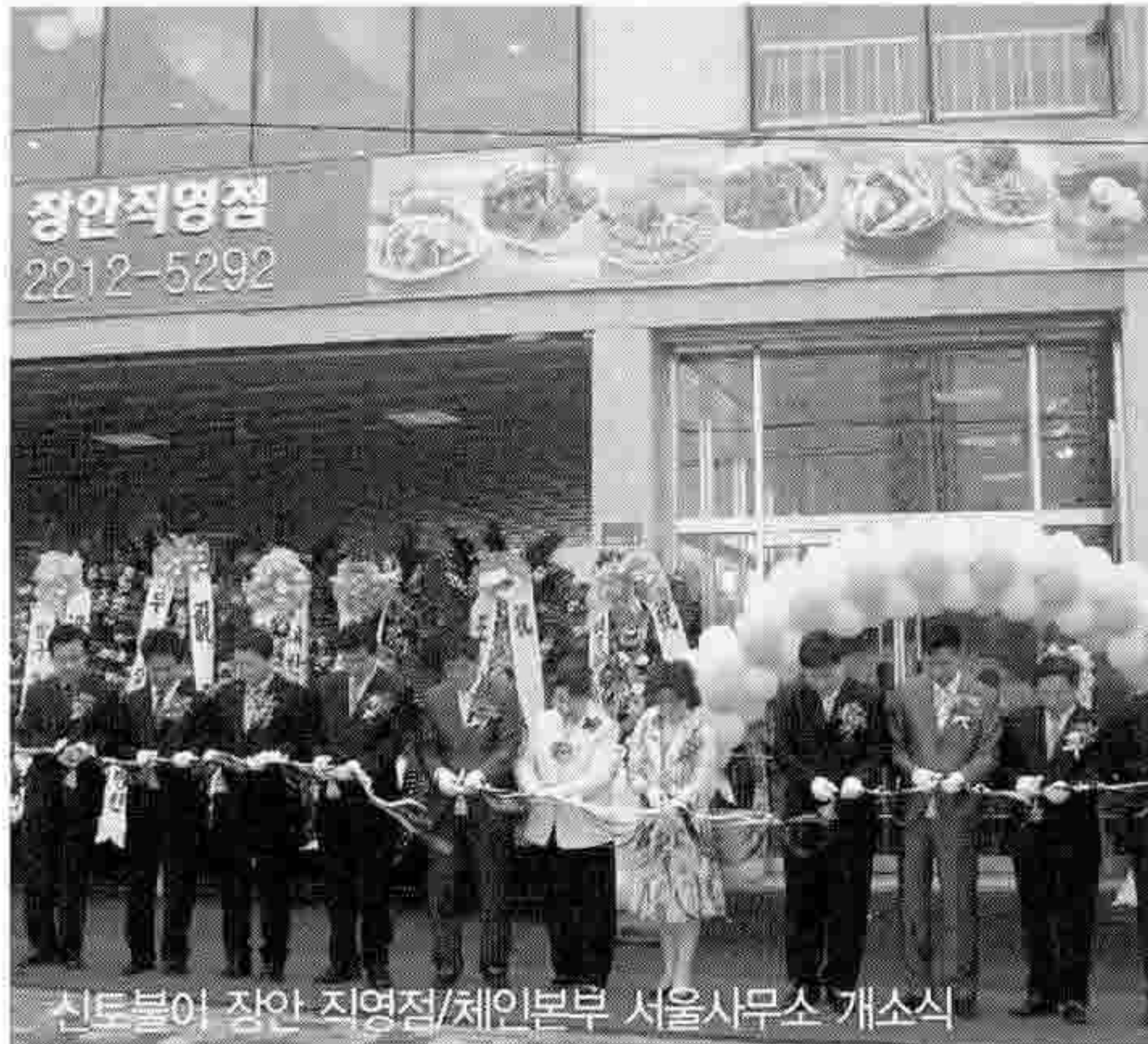
신토불이 장안 직영점/체인본부 서울사무소 개소식