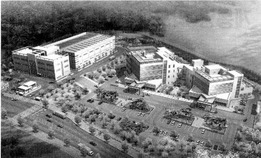
안산분원 시험연구동 모습 (우) 426-170, 경기도 안산시 상록구 사1동 1271-19번지

저천정시험동(높이 5m)은 저압차단기류 특성시험장, 개폐시험장, 계측기시험장, 재료물성시험장, 교정실 등 12개 시험장으로 구성되어 있다.