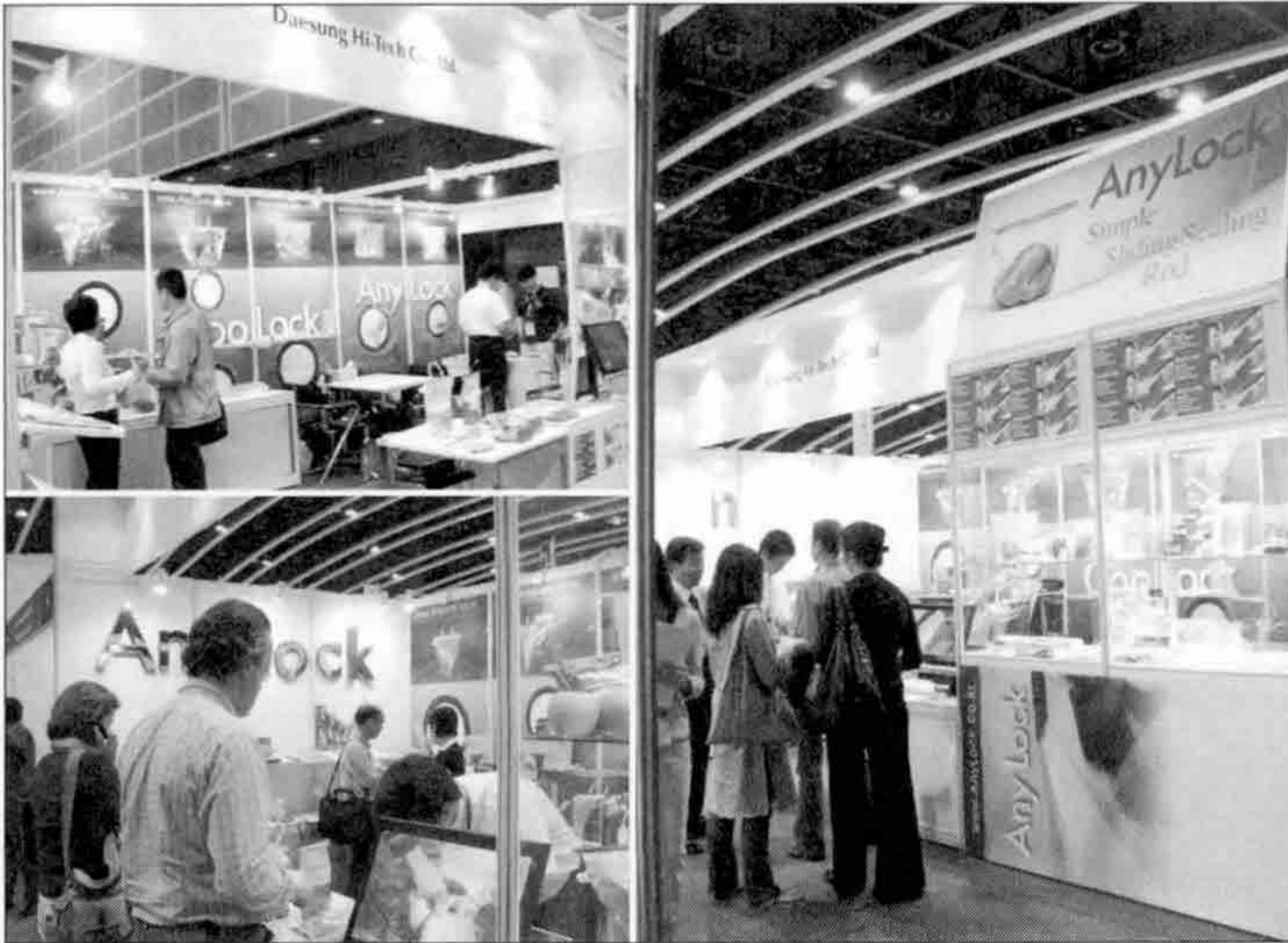
▲ 대성하이텍은 국내외 박람회에 애니락을 출품하여 세계적인 주목을 받고 있다

현재 애니락은 일본, 영국, 독일, 프랑스 등 10여개국에 수출되고 있다. 특히 일본의 경우 3000여개의 오프라인 점포와 홈쇼핑 등에서 애니락이 성황리에 판매되고 있다.