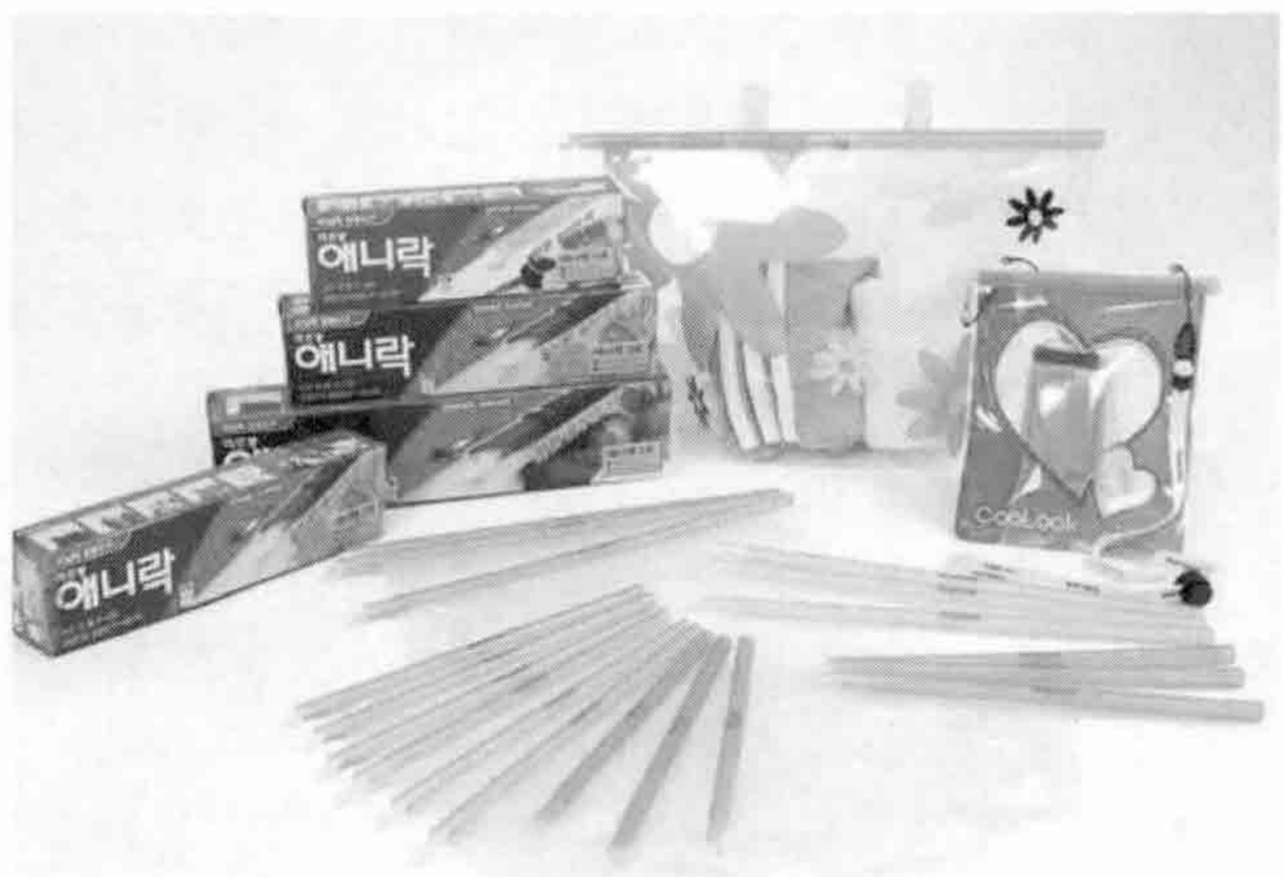
▲ 대성하이텍의 신선잠금 발명특허 '애니락'