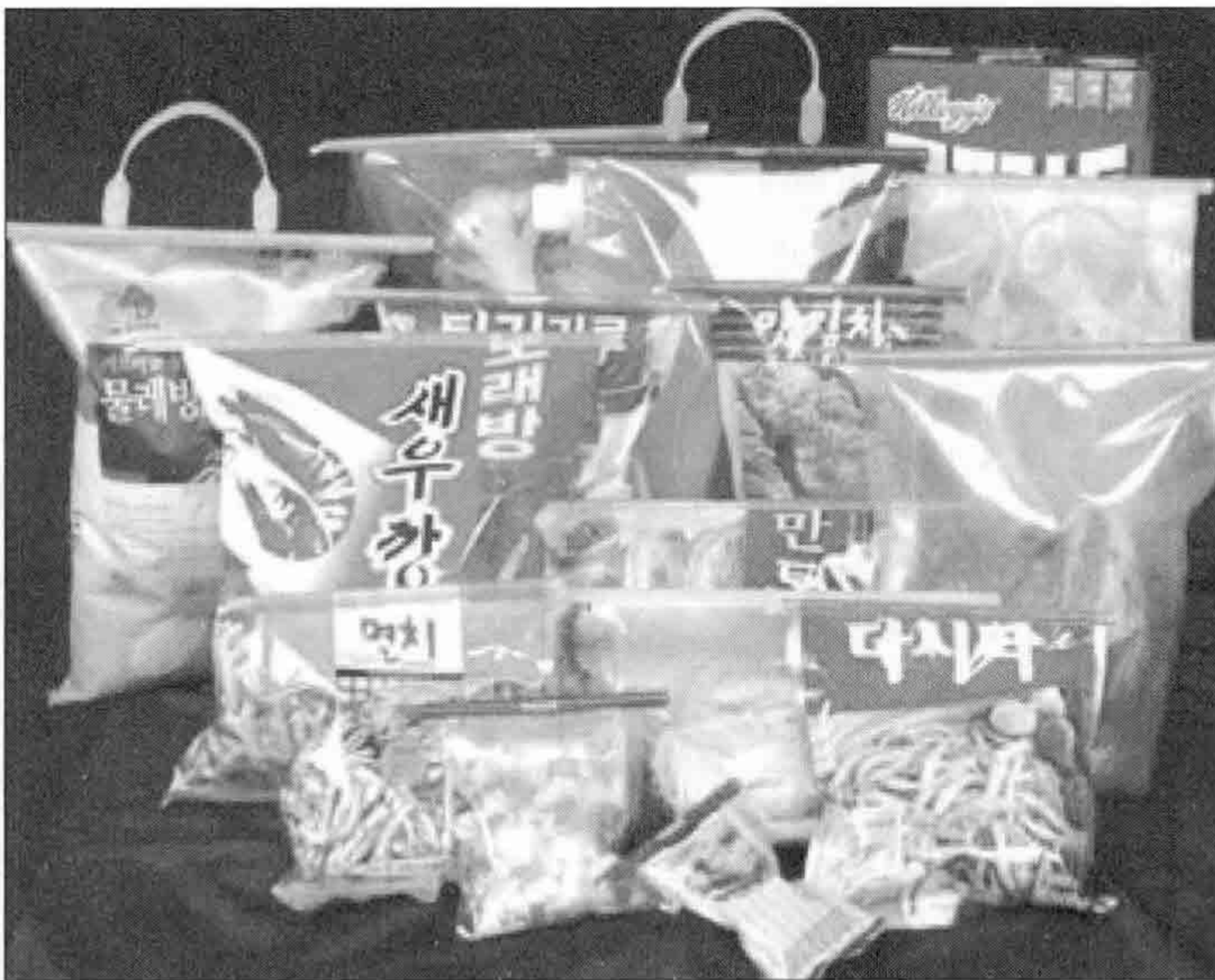
▲ 가정이나 산업용에도 폭넓게 적용 가능한 '애니락'