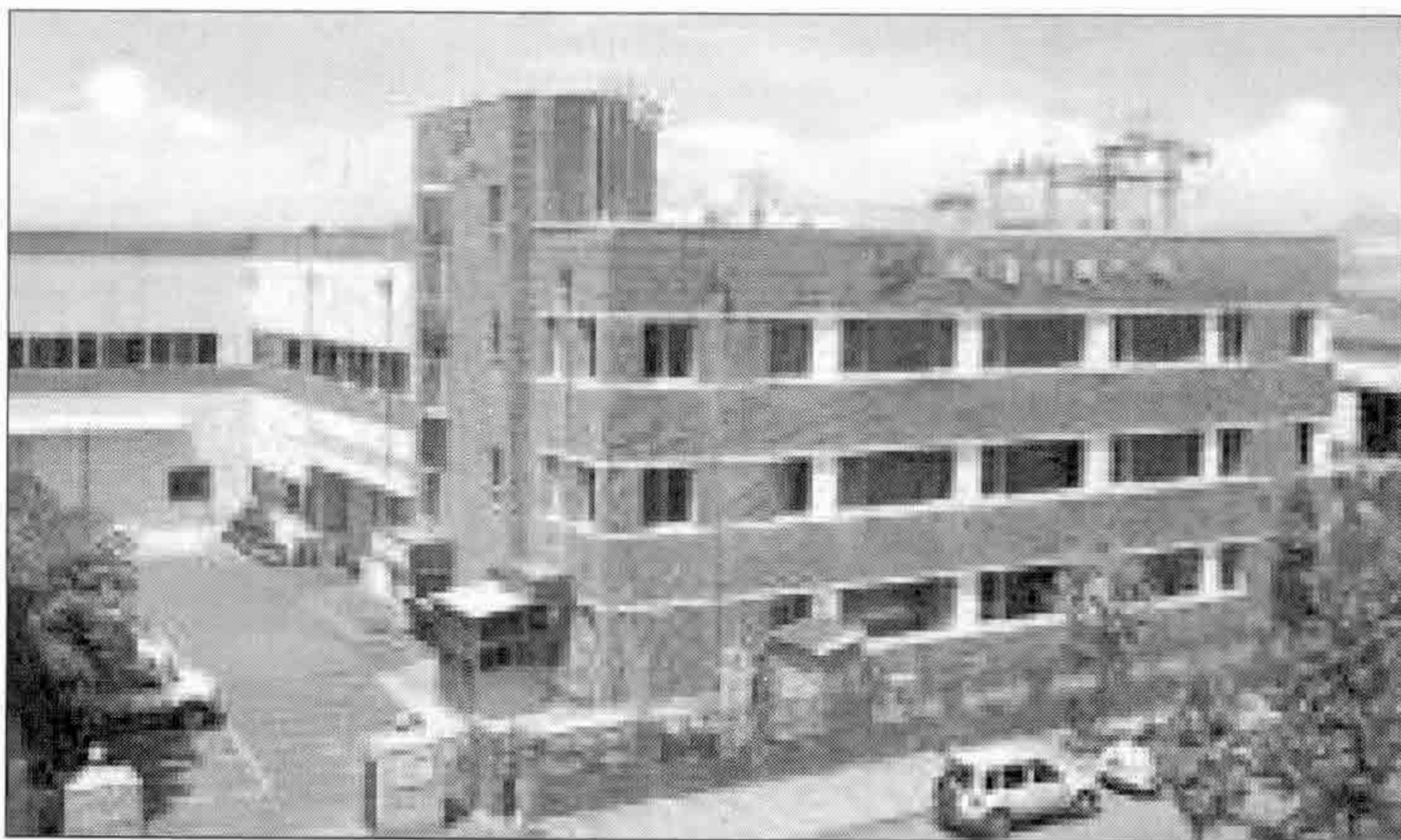
▲ 대성하이텍의 공장전경