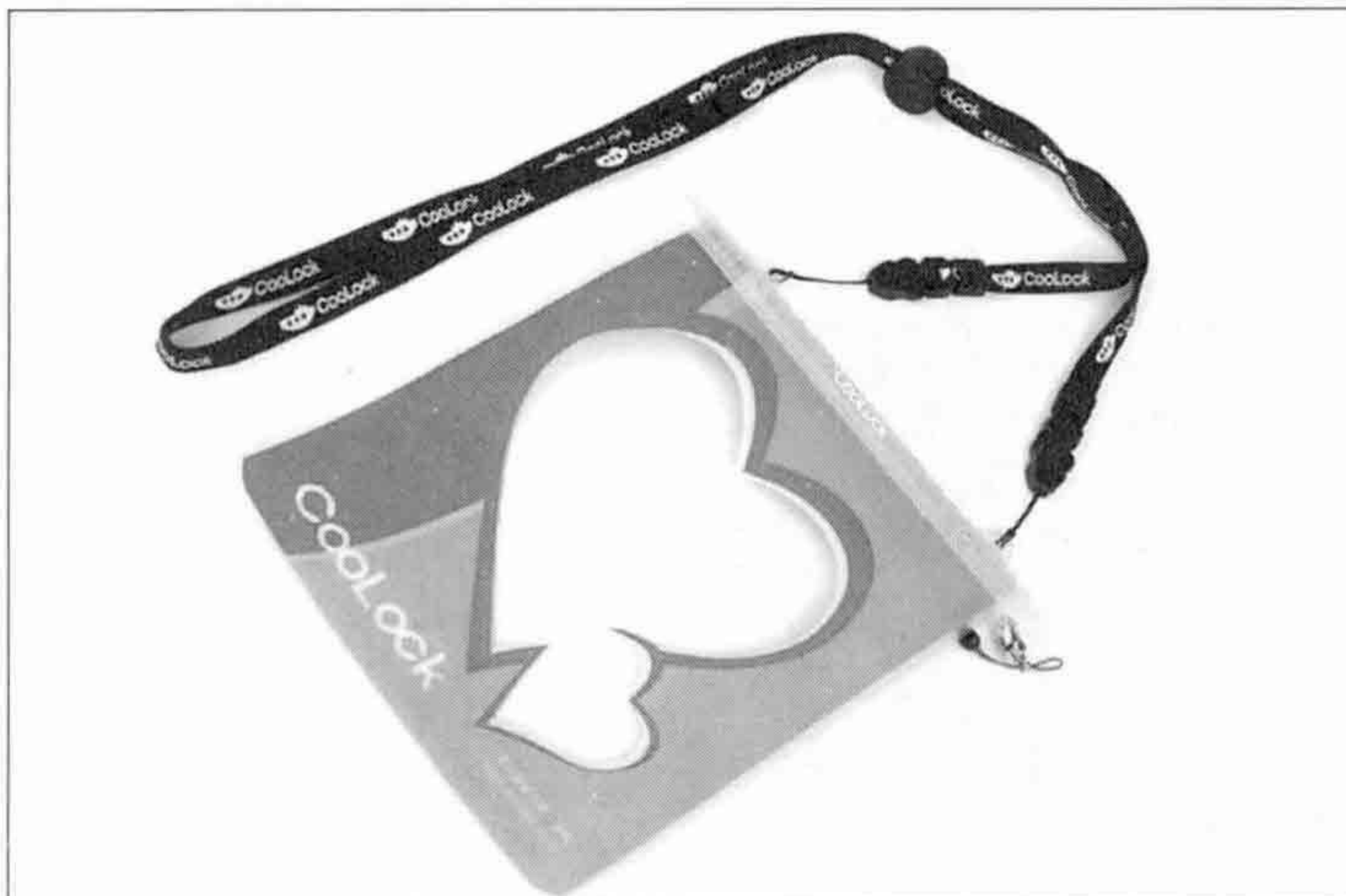
▲ 방수팩 '쿨락'