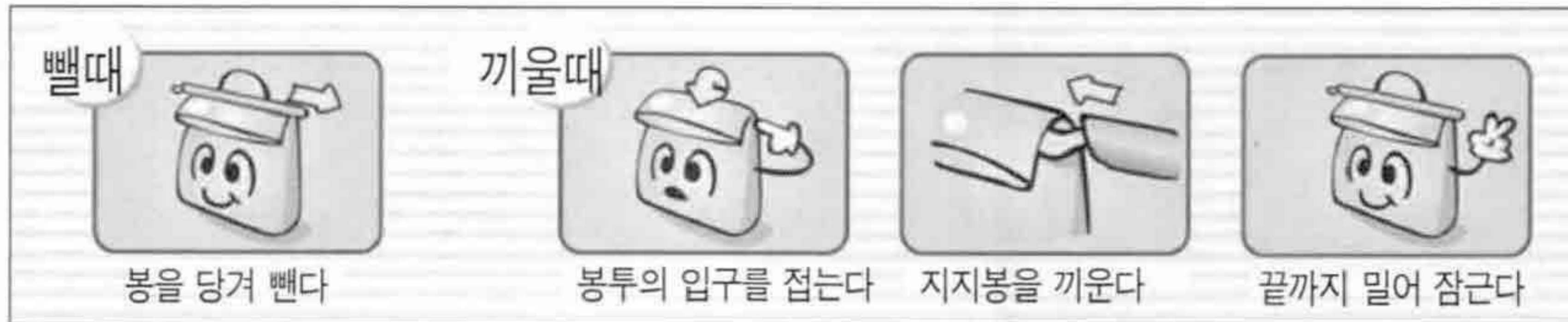
▲ 애니락 사용방법

발명특허 “애니락”인 신개념의 밀봉도구를 개발하면서 사용자에게 큰 인기를 끌고 있기 때문이다.