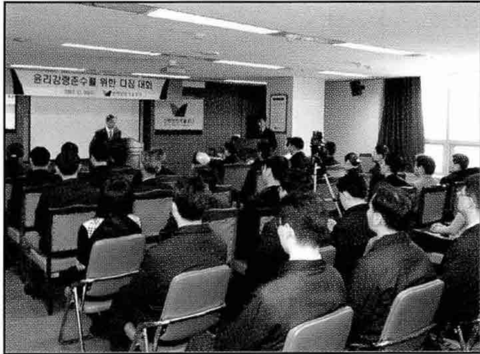
▲ 윤리강령준수를 위한 다짐대회 개최

지난 12월 5일 본부 대회의실에서 전임직원이 참석한 가운데 임직원 “윤리강령준수를 위한 다짐대회”를 개최하였다.