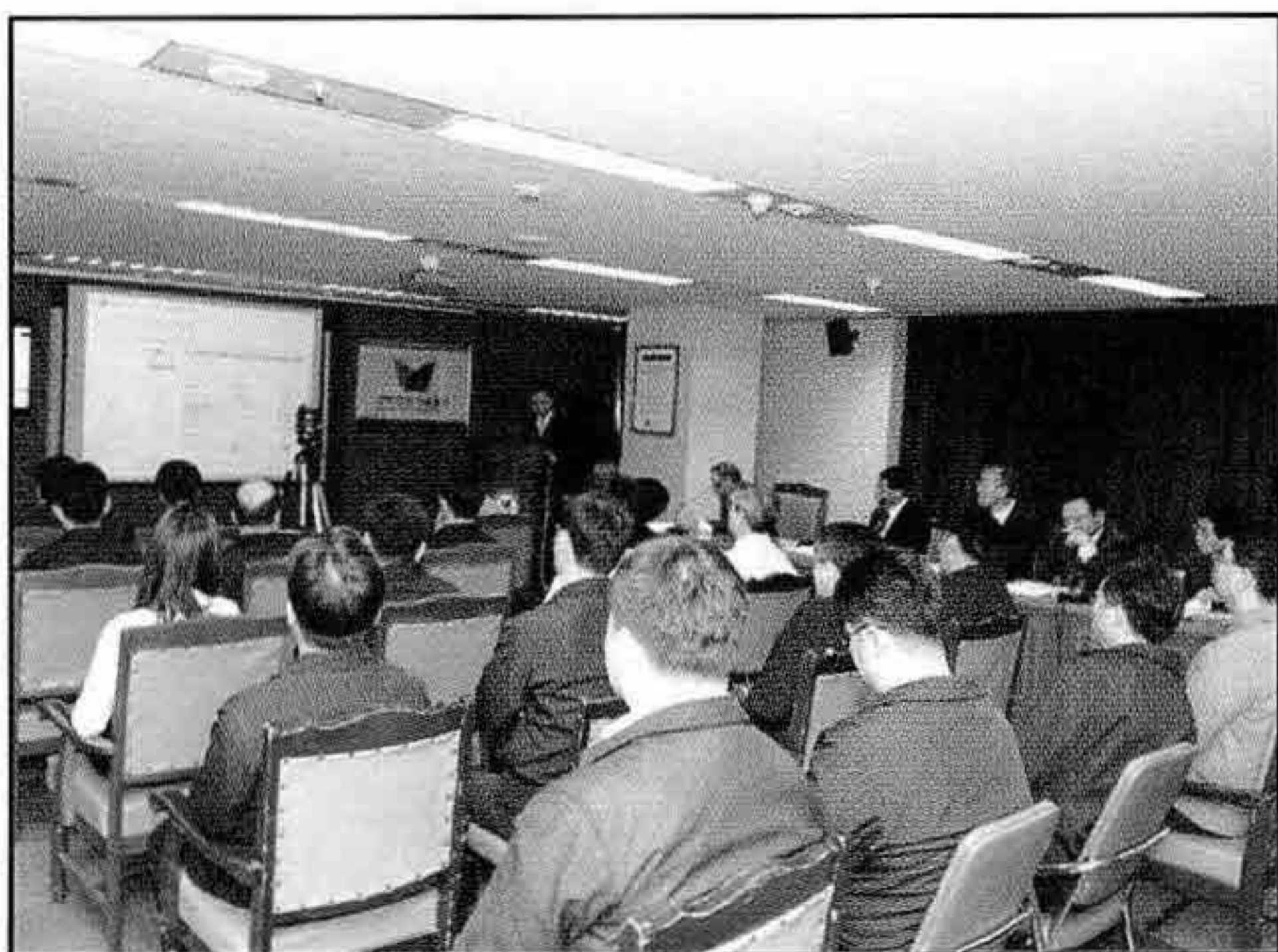
▲ 선박안전정보시스템 완료보고회 개최

지난 12월 18일 본부 대회의실에서 약 5개월간에 걸쳐 진행된 선박안전정보시스템(SIS) 구축을 마치고, 완료보고회를 개최하였다.