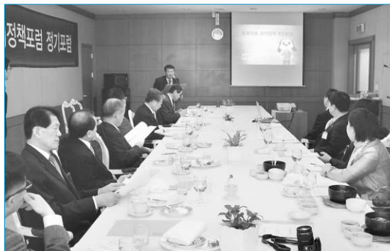
한국수의정책포럼 제11차 정기포럼

이어서 운영회의에서는 제12차 정기포럼의 주제에 대하여 논의하였고, 제12차 정기포럼은 “식품안전관리 조정방향” 등을 주제로 오는 5월 2일(금) 오후 6시부터 경기도수의사회관에서 개최될 예정이다.