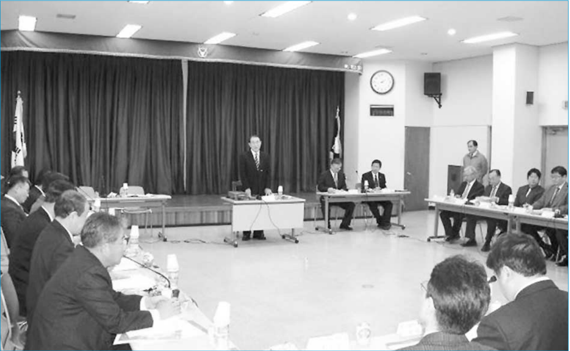
2008년도 대한수의사회 제2차 이사회