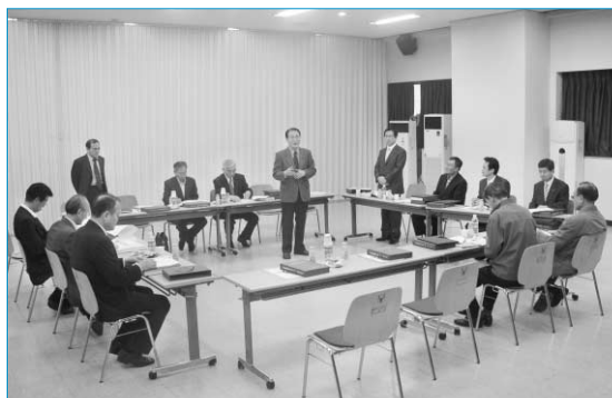
한국수의 60년사 편찬위원회 및 집필위원회 회의

60년사는 지난 1998년 발행한 “한국수의 50년사”의 내용에 10년간의 각 수의분야의 변화 등을 보충하여 새로 발행할 계획이며, 오는 10월 19일 개최될 창립 60주년 기념식을 통해 배포할 예정이다.