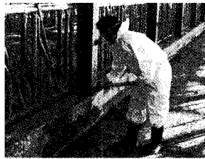
(농장주변 환경정리 중)

2년 전 브루셀라 판정을 받은 후, 소를 처분하고 축사를 계속 비워두다 새로 시작하려는 고창 흥덕작목반 정명중 농가를 지난 11월 12일 전북지역본부(본부장 김철중) 직원 7명이 방문했다.