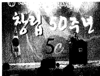
축사 - 『이완구 충청남도지사』