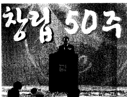
격려사 - 『정영재 대한수협회장』