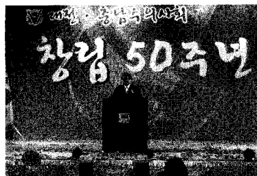
기념사 - 『전무형 대전.충남수협회장』