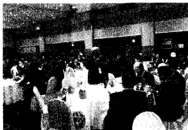
건배제의 - 『윤어인 후원위원장』