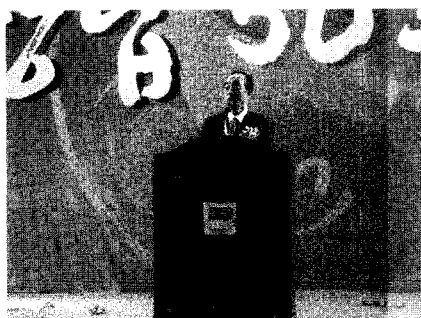
축사 - 『심대명 자유선진당 대표최고위원』