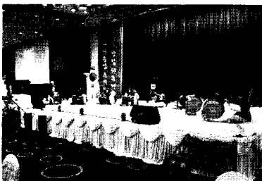
식전행사 - 충남대 수의대 풍물패「한얼」

본 행사 시작 전 2008년도 2차 수의임상연수교육이 '동물보호법과 수의사의 역할 -현황과 전망-' (강사: 백 현) 이란 제목으로 시행되었다.