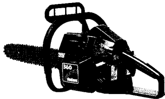
▲ 신다이와 엔진톱(360)

1952년 창립 이래, 소형 엔진 설계, 개발, 제조를 통해 세계 각국에 엔진톱, 트리머, 예초기 등의 제품을 판매 중인 신다이와는 2사이클의 강력한 힘과 4사이클 엔진의 높은 연비를 고루 갖춘 C4 기술로 세계에서 가장 엄격하다는 미국 배기가스 규제 'EPA2'를 통과, 전세계에 최상의 품질을 제공하고 있다.