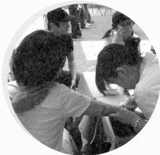
8월 14일 CMF 수련회

이 밖에도 91기계획여단, (주)한화, 궁정교회, 마로니에공원에서 많은 분들이 캠페인에 참여해 주셨습니다. 캠페인에 참여해 주신 모든 분들에게 감사드립니다.