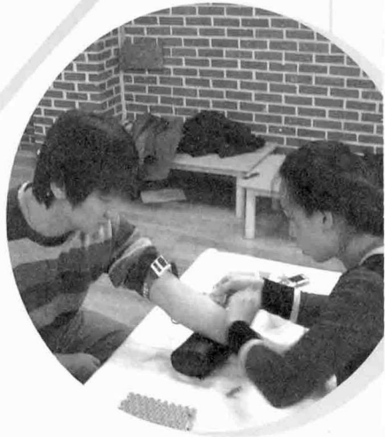
7월 27일 명선교회

개인 및 단체 조혈모세포기증희망신청 문의 (사)한국조혈모세포은행협회 T. 02-737-5533(내선 213)