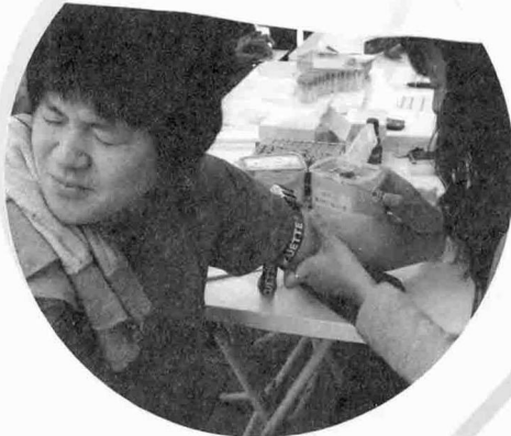
7월 18일 IVF 수련회

조혈모세포기증으로 백혈병, 중증재생불량성빈혈 등 악성혈액질환으로 고생하는 많은 이웃을 도울 수 있습니다. 조혈모세포기증은 작은 사랑의 실천입니다. 소중한 우리 이웃에게 새 생명을 선물하세요.