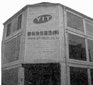
와이아이테크(주) 회사 전경