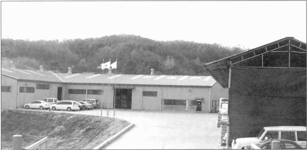
▲ 충북 음성에 위치한 (주)플라스틱과 사람들

Color 및 고농축의 Bead형 Colorants를 보유, 업계에 일익을 담당하고 있다.