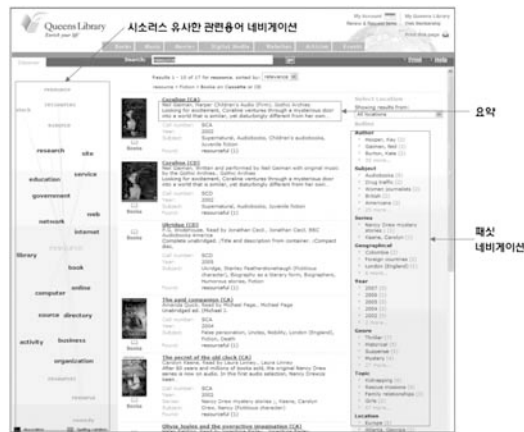
그림 1. 미국 퀸즈 공공도서관 차세대 도서관 목록 인터페이스