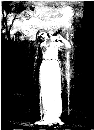
<그림 1> 운디네, 1872 http://www.johnwilliamwaterhouse.com