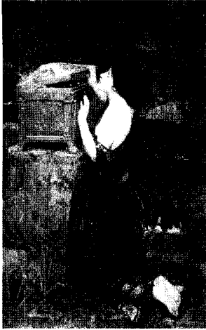
<그림 13> 판도라, c.1896 http://www.johnwilliamwaterhouse.com