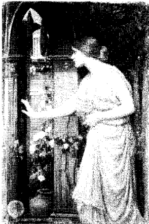
<그림 16> 큐피트의 정원으로 들어가는 프시케, 1904 http://www.johnwilliamwaterhouse.com