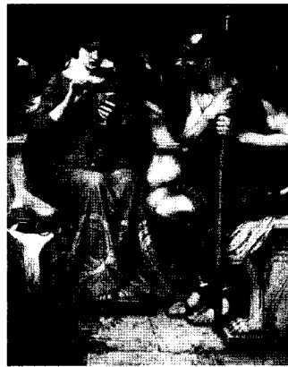
<그림 21> 제이슨과 메디아, 1907 http://www.johnwilliamwaterhouse.com