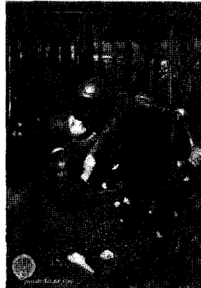
<그림 2> 무정한 미녀, 1893 http://www.johnwilliamwaterhouse.com