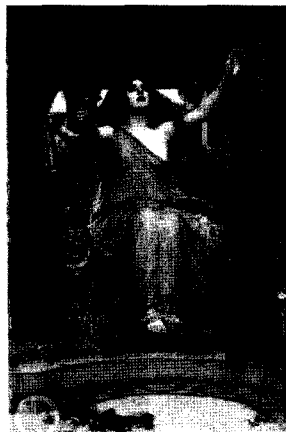
<그림 5> 유리시스에게 잔을 건네는 키르케, 1891 http://www.johnwilliamwaterhouse.com