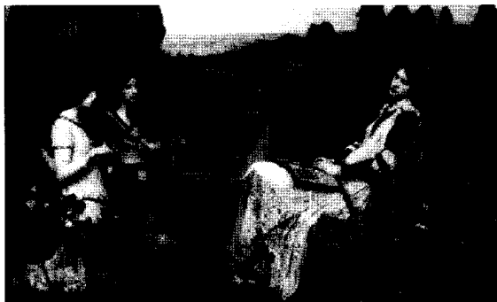
<그림 22> 성 세실리아, 1895 http://www.johnwilliamwaterhouse.com