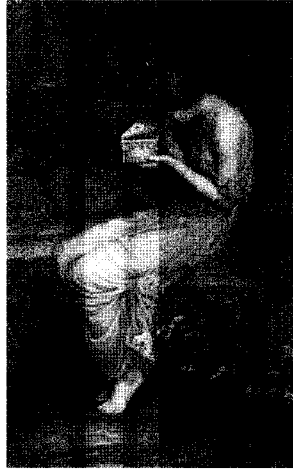
<그림 14> 황금상자를 여는 프시케, 1903 http://www.johnwilliamwaterhouse.com