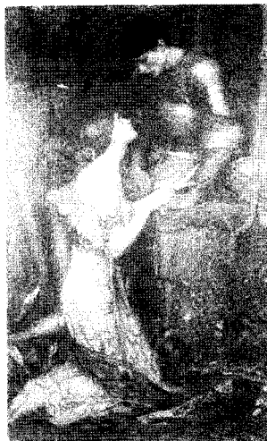
<그림 11> 라미아, 1905 http://www.johnwilliamwaterhouse.com