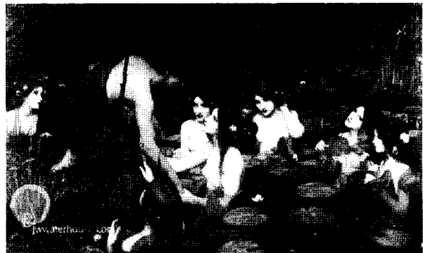
<그림 9> 힐라스와 님프들, 1896 http://www.johnwilliamwaterhouse.com