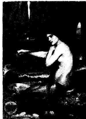
<그림 4> 인어, 1901 http://www.johnwilliamwaterhouse.com