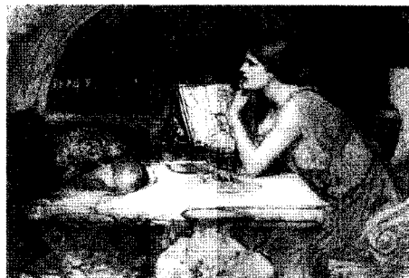
<그림 18> 키르케, c.1911 http://www.johnwilliamwaterhouse.com