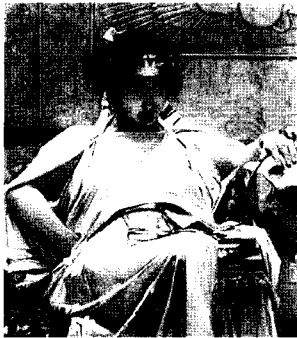
<그림 20> 크레오파트라, 1888 http://www.johnwilliamwaterhouse.com

빅토리아시대 상류층에서는 화려한 핑크나 붉은 색은 야한 색으로 인식하고 흰색이나 핑크와 같이 온화하고 부드러운 파스텔조 색상을 여