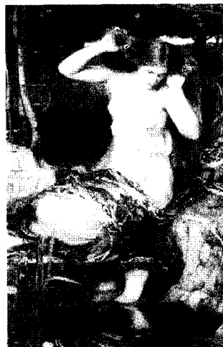
<그림 12> 라미아, 1909 http://www.johnwilliamwaterhouse.com