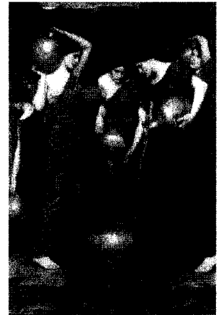
<그림 19> 다니이데스, 1904 http://www.johnwilliamwaterhouse.com