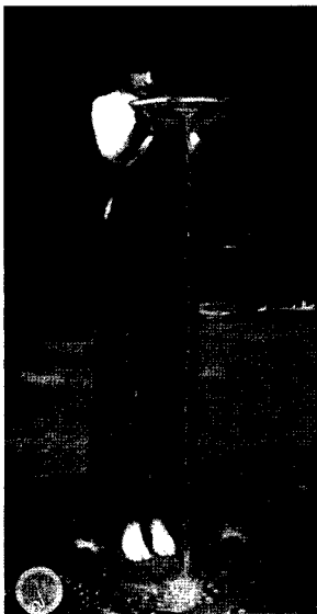
<그림 6> 질투의 키르케, 1892 http://www.johnwilliamwaterhouse.com

헤어나오지 못하는 바다, 햇빛이 들지않는 깊은 숲, 동굴과 같이 물이 많고 독립적인 장소에 인어나 사이렌 등의 님프를 그려넣어 악녀성을 상징한다. 이러한 연유에서 <그림 6>, <그림 7>, <그림 8>, <그림 9>를 비롯한 여러 그림에서 볼 수 있듯이 워터하우스의 팜므 파탈 이미지에는 물이 계속적으로 등장하고 있으며 팜므 파탈의 치명적인 죽음과 여성과 물을 관계 짓고 있다.