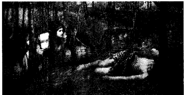
<그림 7> 나이아드, 1893 http://www.johnwilliamwaterhouse.com