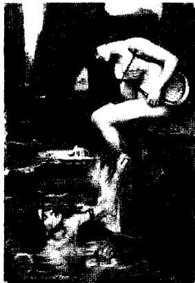
<그림 3> 사이렌, 1900 http://www.johnwilliamwaterhouse.com