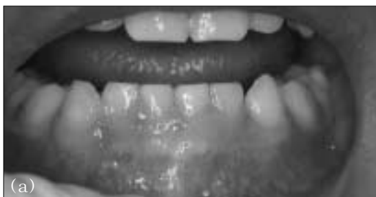
Fig. 6. Intraoral photograph after 6 months. No sign of either clinical or radiographic pathosis was detected.