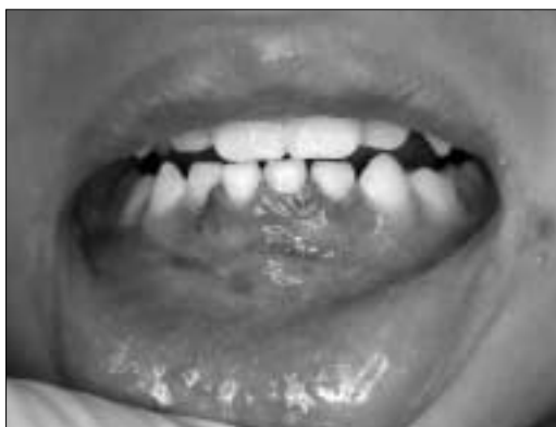
Fig. 1. Initial intraoral photograph. Displacement of the fractured alveolar bone fragment was observed, which included the two lower primary central incisors.

어린이는 성인과 해부학적, 생리학적, 심리적 발달 과정의 차이가 있으므로 진단 및 치료시 좀 더 보존적으로 접근해야 하며, 악안면부의 골절은 향후 성장 발육에 영향을 주어 부정교합, 비대칭, 개교합 등의 안면 변형을 일으킬 가능성과 하방 영구치배의 손상 가능성이 있으므로 장기간의 관찰이 필요하다 6,8) . 또한 어린이는 치유 속도가 빠르며, 골형성 능력이 크기 때문에 초기