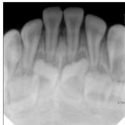
Fig. 2. Initial radiographic view. No obvious sign of fracture on the alveolar process.