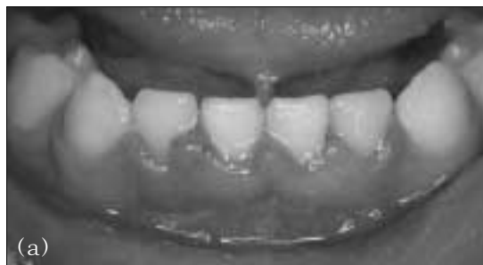
Fig. 5. Intraoral photograph after splint removal. The splint was removed after 3 weeks. (a) Bony segment did not show any mobility. (b) No radiographic sign of pathosis.