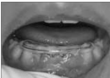
Fig. 4. Intraoral photograph after one week. Splint was stable, and slight gingival swelling and redness was observed.