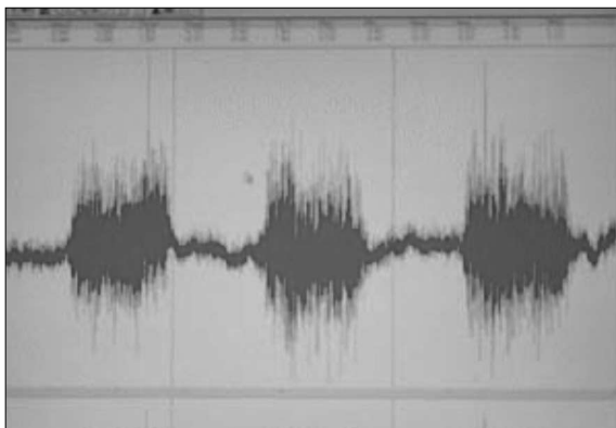
Fig. 5. Recorded Electromyographic Activity