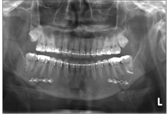
Fig. 2. Postoperative Radiograph Showing Monocortical Screw Fixation