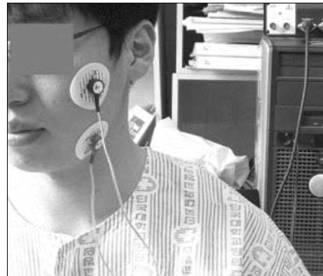
Fig. 4. Photograph Showing That Taken The Electromyographic Activity